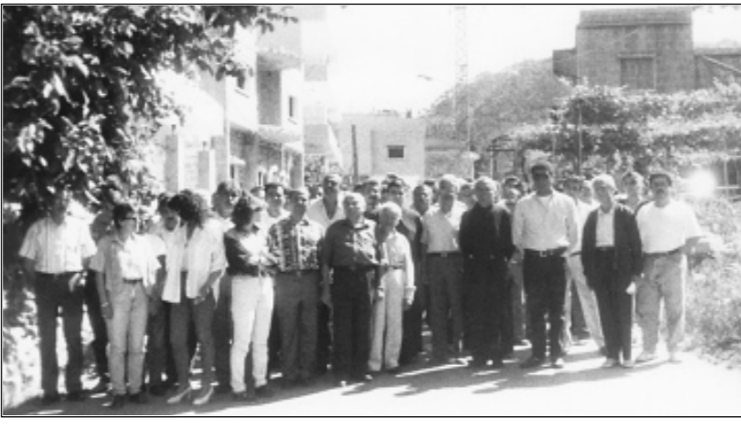
جمع من أهالي جزين خلال تظاهرة امس في المدينة.

جلسة مجلس الوزراء مساء امس كانت اشد التناسل من الجلسة السابقة من حيث انقسام المواقف الوزارية حيال اقتراحات تعديل القرارات.