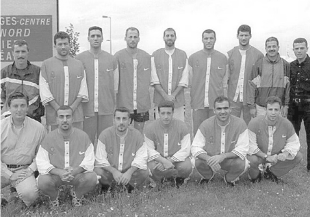
منتخب لبنان لكرة السلة في معسكره التدريبي في مدينة ليموج الفرنسية.

ذهبية وقميص ابيض بقبة عالية وسروال فستقي للرجال، صدرية حمراء وقميص ابيض وتنورة فستقية للسيدات. وتتقدم البعثة في عرض الافتتاح فتاة ترتدي اللباس الفولكلوري التقليدي باللونين اعينها مع الطنطور.