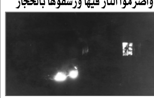
عنصر من الدفاع المدني يطل على الحريق من نافذة في الجمة الجنوبية لمحرقه العمروسية.