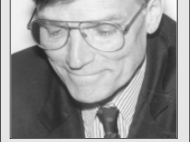
الدكتور جون واتروري الرئيس الجديد للجامعة الاميركية.

توجه رئيس الجمهورية الياس الهراوي لنادية رعايته احتفال التخرج السنوي لطالب الجامعة الاميركية ردا على الكلمة التي القاها خطيب الاحتفال الدكتور رياض ايراني (خريج الجامعة الاميركية في بيروت عام ١٩٥٢ قبل انتقاله الى اميركا) رئيس احدى اكبر شركات النفط الاميركية، الى الرئيس الاميركي بيل كلينتون بكلام شديد اللجة عاكسا خيبة امل لبنان بالسياسة الاميركية حياله وحياي السلام. وقال، "اننا ناشد الرئيس كلينتون المبادرة من اجل تطبيق العدالة الدولية في - التتمة في الصفحة ٢٠ -