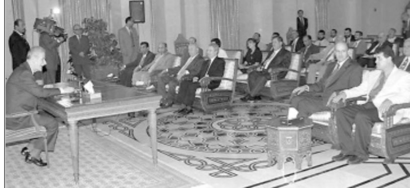
الرئيس السوري حافظ الاسد في لقائه اعضاء الوفد الإسرائيلي أمس في دمشق.

وصف امس الرئيس السوري حافظ الاسد الوضع في منطقة الشرق الاوسط بأنه "معقد" وامل "الا نصل الى ما هو اسوأ مما نحن فيه". وفي لقائه اعضاء وفد فلسطيني ١٩٤٨ الذي يزور سوريا، سمع من النائب العربي الإسرائيلي نواف مصالحة مضمون رسالة خطية من زعيم حزب العمل ايمود باراك لم يتسلمها اي مسؤول سوري. وقال مصالحة ان الرسالة مع باراك قبل توجهه لزيارة سوريا.