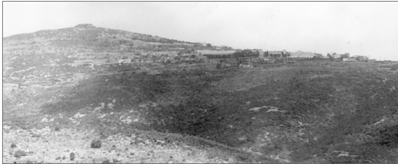
الموقع الذي اخذه جيش لبنان الجنوبي الى أعلى الصورة وبدت صيدون تحت. (احمد منتش)

لاقليم التفاح. وهذا ما يجعل خطوة دخول الجيش الى هذا المحور محفوفة بالمخاطر. وبعدها سيقوم الجيش بالانسحاب من صيدون. وبعدها سيقوم الجيش بالانسحاب من صيدون. وبعدها سيقوم الجيش بالانسحاب من صيدون.