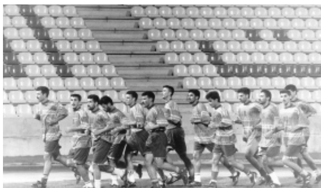
منتخب العراق الضيف يؤدي مرانته الاول تحت الاضواء مساء امس على الملعب عينه في اشراف مديره الفني عموبابا.