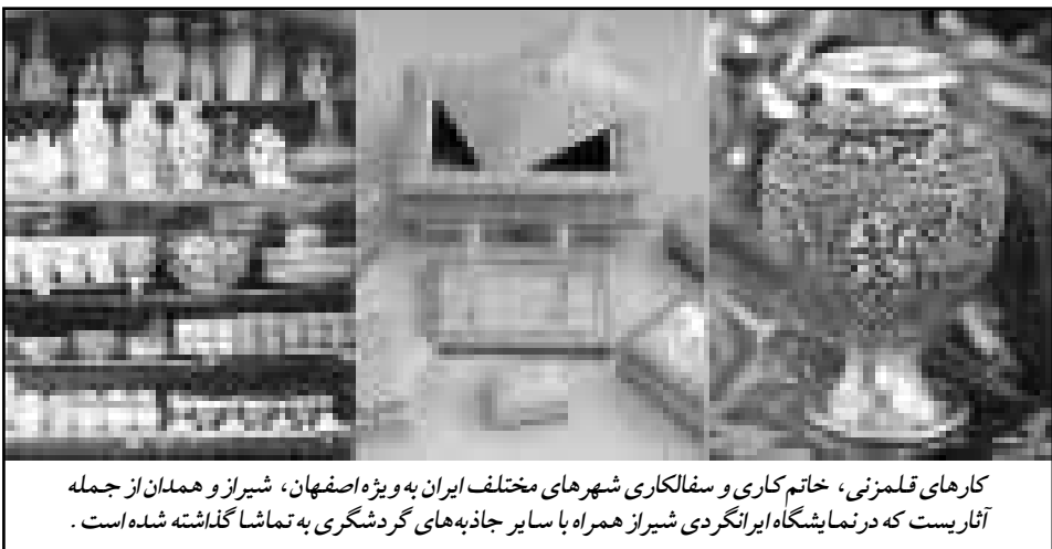
کارهای قلمزنی، خاتم کاری و سفالکاری شهرهای مختلف ایران به ویژه اصفهان، شیراز و همدان از جمله آثار پست که در نمایشگاه ایرانگردی شیراز همراه با سایر جاذبه‌های گردشگری به تماشا گذاشته شده است.

۳ قطر ۳ سانتی متر در می آوردند. آنگاه ۲۰ مقال طلای ۲۴ عیار را که به صورت ورق کاغذ نازکی درآمده و به وسیله حرارت روی این مفتول نقره می‌سختند. این مفتول ۲۵ سانتی متری طلا و نقره سرانجام به نخی به طول ۴۰ هزار متر و قطر ۶ صدم میلی‌متر تبدیل می‌شود. این نخ که «نقد» نامیده می‌شود روی نخ آبریشم پیچیده و کلاتون نام می‌گیرد و پارچه‌های زربافت با