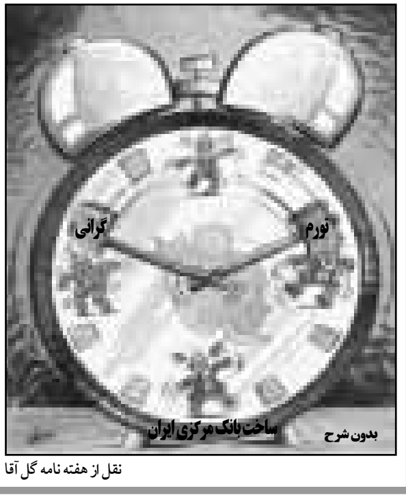
نقل از هفته نامه گل آغا

«مردم به طور متوسط در هر دقیقه بیش از شش بار در معرض صدای نا‌هنجار قرار دارند...» کیهان