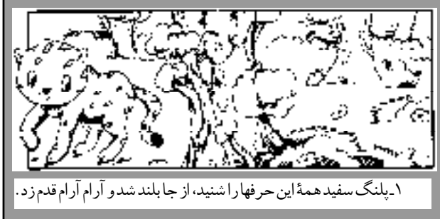
۱- پلنگ سفید همه این حرفها را شنید، از جا بلند شد و آرام آرام قدم زد.

طراح: حسین شمشکلاتی از: سیمینهای شجاعی ۱ پلنگ سفید: پلنگ‌ها خشمگین و عصبانی فریاد زدند: «ته! این کار را نکن!» یکی گفت: «این کار باعث شرمندگی پلنگ‌ها می‌شود.» آن یکی گفت: «آدمها همیشه با پلنگ‌ها دشمن هستند.» پلنگی که بزرگتر از همه بود، گفت: «تا به حال هیچ آدمی به پلنگ‌ها مهربانی نکرده است.» و خیلی حرفهای دیگر