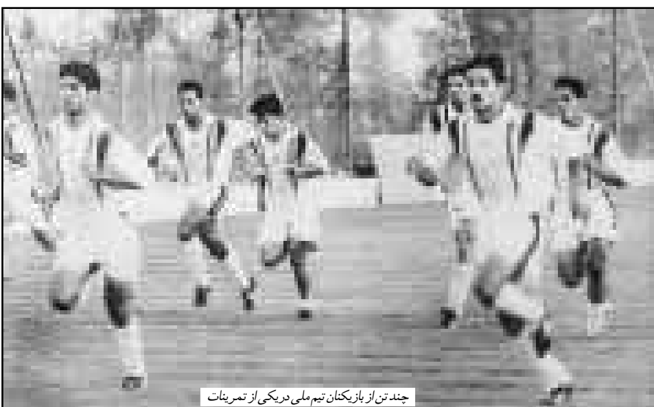
چندان از بازیکنان تیم ملی در یکی از تمرینات

بازیکن خود را که چندی پیش در تیم منتخب آسیا بازی کرد، به همراه دارد. خبرنگاران چینی از آمدن «دایی» به دالیان اظهار شگفتی کرده‌اند. در این ارتباط مطبوعات ورزشی چین نوشتند علی دایی خط خورده، بلکه او هم اکنون در دالیان منتظر بازی روز شنبه است.