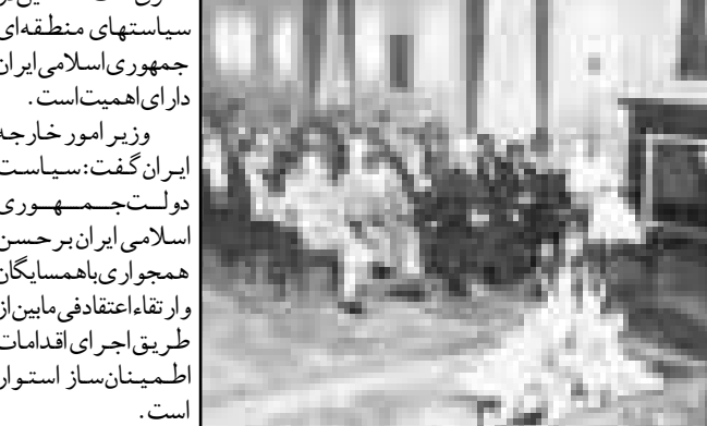
آقای کمال خرازی وزیر امور خارجه اصول سیاست های ایران را در روابط بین المللی، برای سفرا، کارداران خارجی و نمایندگان سازمان های بین المللی تشریح می کند

همکارهای تجاری بین المللی و احترام به حقوق بین المللی در زمینه تجارت، جامعه جهانی باید با اقدامات و تحریمهای یک جانبه اقتصادی زور مدارانه که مغایر خواست جامعه بین المللی است، مقابله کند و از گسترش این روند خطرناک جلوگیری کند. وی افزود: برای جهان شمول شدن سازمان تجارت جهانی باید