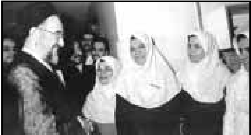
تبریک رئیس جمهور به «بهترین بندگان خدا» رئیس جمهور روز دوشنبه که در ایران روز پرستار بود بدون اطلاع قبلی به بیمارستان لیانی نژاد رفت و ضمن عیادت از بیماران بستری در این بیمارستان روز پرستار را به پرستاران تبریک گفت و آنها را «بهترین بندگان خدا» نامید. بیمارستان لیانی نژاد در شمال تهران (خیابان پاسداران) قرار دارد و با ۳۵۰ تخت در بخش های فوق تخصصی چشم، بیماریهای کلیوی و داخلی فعالیت می کند. عکس رئیس جمهور را هنگام گفتگو با پرستاران بیمارستان نشان می دهد.

● وزارت اطلاعات باید نور نظام باشد و زمینه خردورزی را برای نظام فراهم آورد. ● در صورتی نظام ما امن است که مردم احساس امنیت و راحتی کنند.