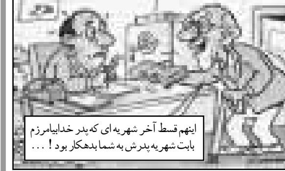
نقل از هفته نامه گل آقا

«اکثروالدین که کارمند هستند، شهر به مدارس غیرانتفاعی نرندشان در افساط طولانی برداخت می‌کنند.» خبرنامه گل آقا