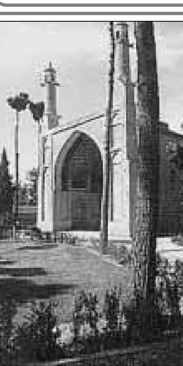
اصغهان سمنار جنبان

وی گفت: این عشق و علاقه در جوانی و از سابق در من بوده است در گذشته‌ها هر ده کاری که انجام می‌دادم ۹ تای آن با شکست روبه‌رو