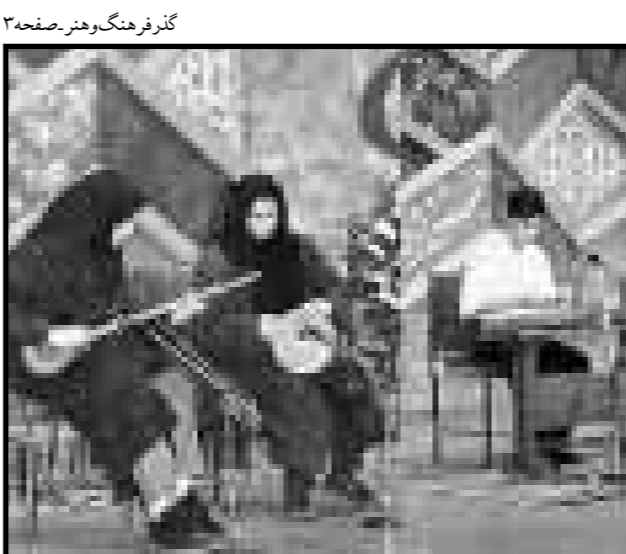
گروه هنر، صفحه ۳

سفیر و نماینده دائم ایران در یونسکو: ایران به گفتگو و تبادل اندیشه با تمدنها و فرهنگهای دیگر علاقمند است