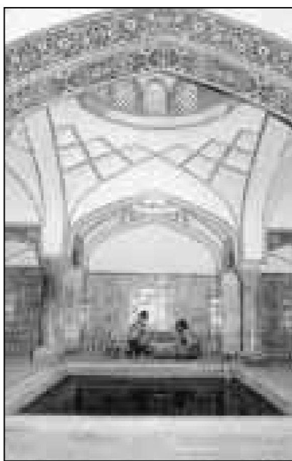
KERMAN - 164,000 Iranian and foreign tourists have visited the Ganj-ali Khan historical monuments in the ancient city of Kerman in the first half of this year, the provincial Cultural Heritage Organization said on Saturday.

The Ganj-ali Khan monuments included a mosque, a square, a bath, coinage office (office for minting coins), carvansaray and marketplace left from Safavid era.