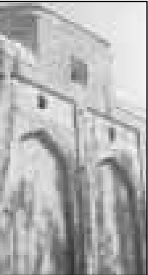
کتبه سرخ در مراغه

کشت درخت خرما در اکثر شهرستانهای استان سیستان و بلوچستانگر شرایط مناسب آب و هوایی این استان و سازگاری درخت