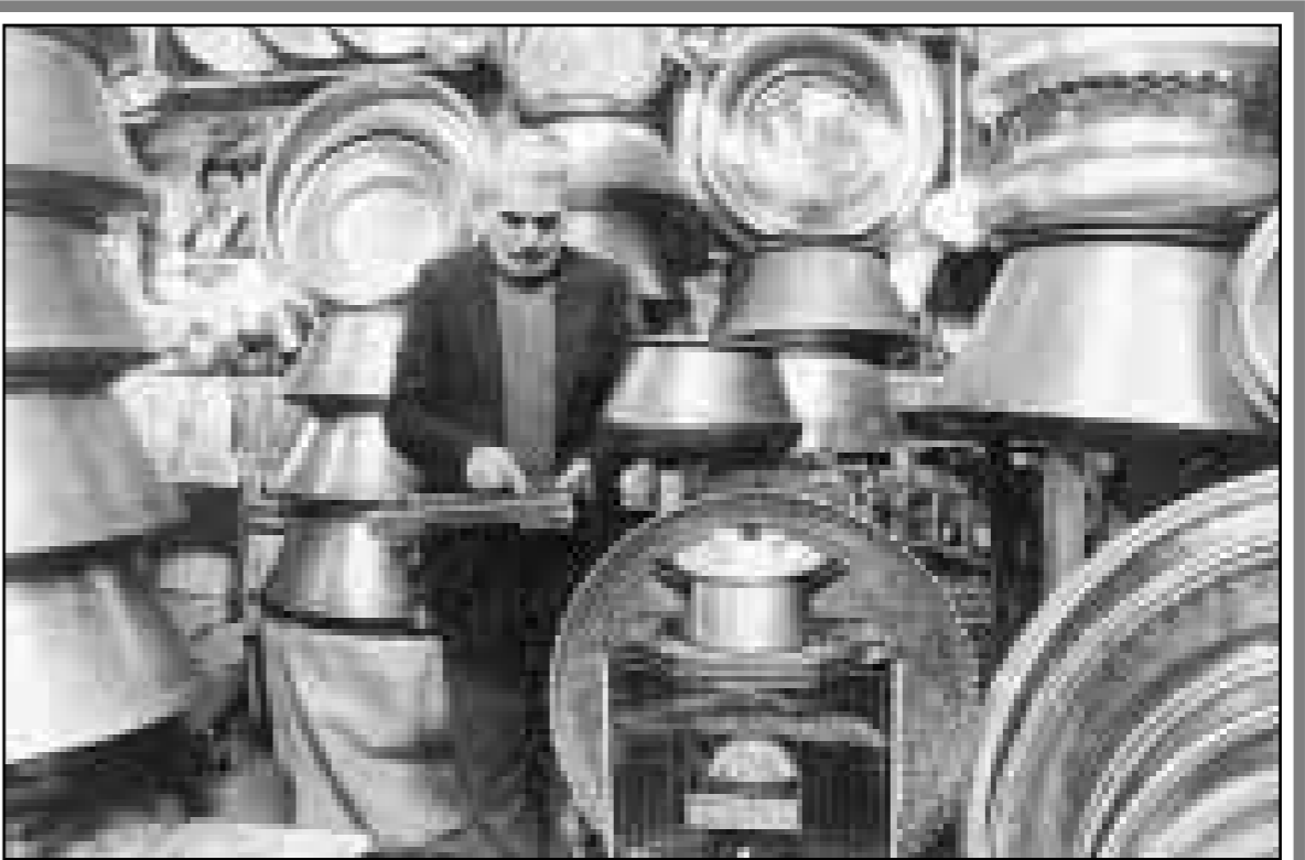
دکان مسگری بازار تبریز