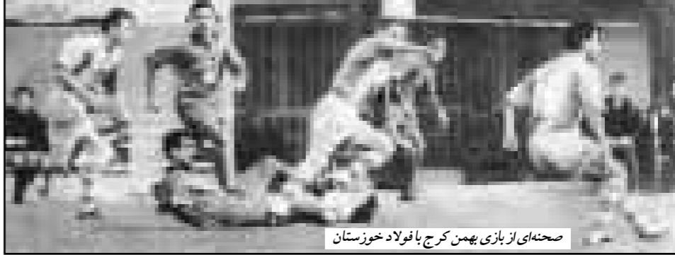
صحنه‌ای از بازی بهمن کرج با فولاد خوزستان

در ادامه مسابقه‌های فوتبال دسته اول قهرمانی باشگاه‌های ایران (جام آزادگان) روز سه‌شنبه چهار دیدار در شهرهای مختلف برگزار شد.