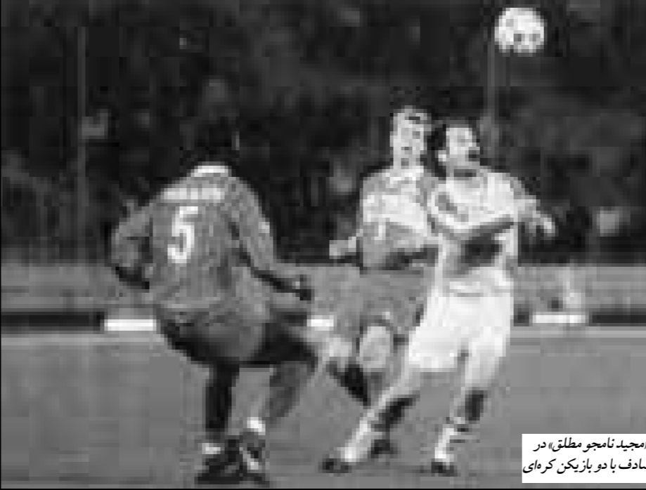
«مجدید نامجو مطلق» در