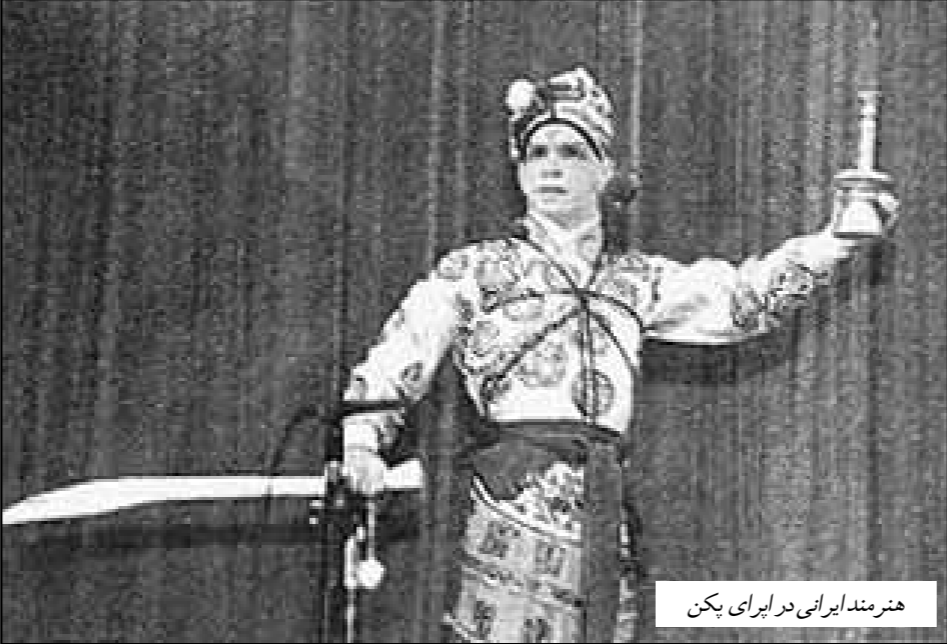
هنرمند ایرانی در اپرای پکن

یافت. «اپرای پکن» آمیزش‌های از هنرهای سنتی مختلف چین از قبیل آواز، سرود، رقص، موسیقی، حرکات جنگیوانه و... است که با لباس‌های زیبایی دوران امپراتوران چین به وسیله هنرمندانی که صورت آنان نقاشی شده، اجرا می‌شود. «اپرای پکن» بسیاری تخصصی است و هر بازیگر تخصص خاصی