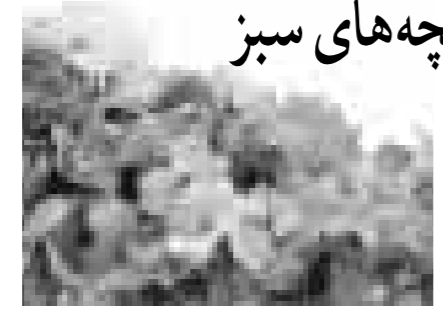
به امید روزی که جوجه‌هایم بتوانند پرواز کنند و من با آنها از اینجا بروم و از خانه مادربزرگم برای شما بشمارم.