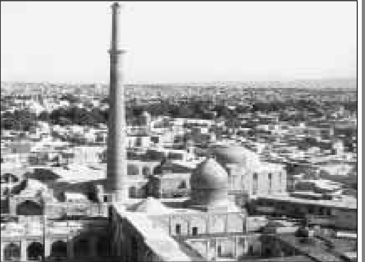
اسفهان ـ نمای هوایی منار و مسجد علی و امامزاده هار و ن ولایت

انتظار می‌رود در صورت انتخاب قطعی جیو وونگ جی به نخست‌وزیری، چین روند اصلاحات اقتصادی در این کشور شتاب بگیرد و از