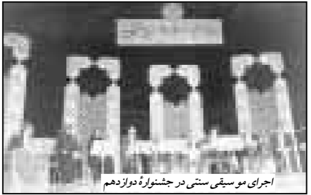
اجرای موسیقی سنتی در جشنوارهٔ دوازدهم

بخش مسابقهٔ جشنوارهٔ موسیقی فجر امسال، علاوه بر ارزیابی آثار هنرمندان