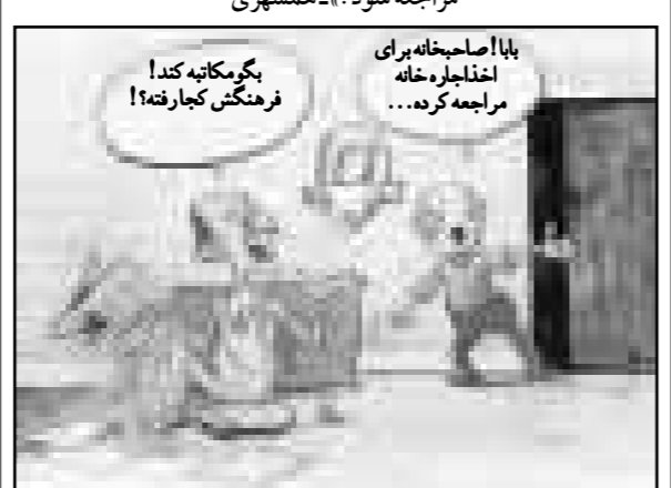
نقل از هفته نامه گل آقا

«وزیر پست و تلگراف و تلفن گفت: باید فرهنگ مکتبه، جایگزین مراجع شود.» - همشهری