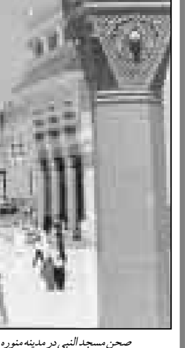
صحن مسجد النبی در مدینه منوره

آقای کیارستمی عزیز «طعم گیلان» شما امشب، برای ما طعم ایران و فرهنگ معنوی و دینی ایران بود. طعم ارزش‌های نفهته در سنت ما بود، و طعم توانایی‌های بالقوه نسل نو ما، برای آفرینش‌های بزرگ جهانی فراوان دیگر. تا‌باد چنین‌با‌دا، متشکرم.