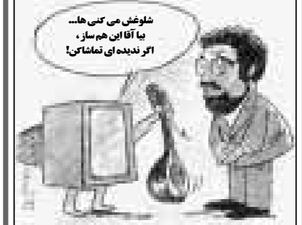
نقل از هفته نامه گل آقا

«پرویز مشکاتیان گفت: من هنوز علت این که تلویزیون، ساز را نشان نمی‌دهد، نفهمیده‌ام.» - مهر