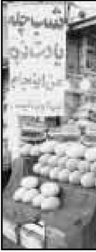
خاندان می کنند...