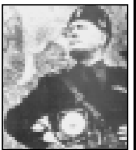
رم. فوریه. به موجب اخبار واصله «موسلینی» عقرب‌تپ به سوی «گادل کامینات» ملک شخصی خود واقع در میان رهبسیار خواهد گردید و عقیده برخی از محافل بر آن است که استنتر است موسلینی با قامت کنونی هیچ‌تندر در «برجسکان» ارتباط دارد و باید دانست که معمولاً پس از اینگونه استراحت‌ها موسلینی تصمیم‌های مهمی را اعلام می‌دارد و شورای عالی فاشیست نیز روز چهارم مارس تشکیل خواهد شد و بعین است که عقرب‌تپ مسائل مهمی از قبیل مناسبات ایتالیا و انگلیس و روابط ایتالیا و انگلیس و روابط اسپانیا و قبیضه اروپای مرکزی داخل در مرحله مهمی خواهد گردید و به‌یهی است که ملاقات هیتلر با شوشینک در «برجسکان» محور رم و برلن را بیش از پیش تقویت خواهد کرد. جراید راجع به ملاقات نامبرده به طور مستقیم تفسیری نمی‌نگازند ولی با استناد به مندرجات روزنامه‌های اتریش و آلمان تأیید می‌کنند که مذاکرات مذکور در استقرار صلح مؤثر خواهد بود ولی این قضیه را اعتراف می‌کنند که مسائل کلی مربوط به دو کشور هنوز حل و تصفیه نگردیده است.

نقل از اطلاعات ۲۷ بهمن ۱۳۳۶ تصمیمات موسلینی چه خواهد بود