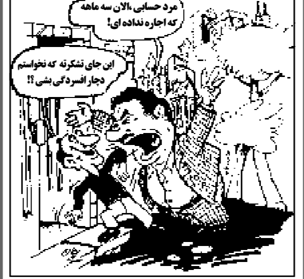
«بولدراهای بیشتر دچار افسردگی می‌شوند.» - ایران