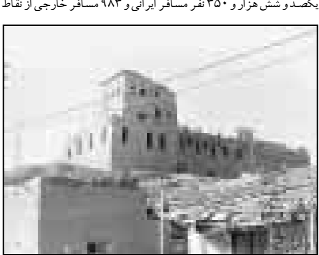
قلعه نضوری سیراف در بندر طاهری

وی افزود: هم اکنون استان بوشهر دارای ۱۸ واحد اقامتی با ظرفیت ۴۲۶ اتاق و یک‌هزار و ۱۰۷ تخت و نیز تعداد ۲۵ واحد پذیرایی بین‌راهی است. حاجی نور مستول امور سیاحتی استان بوشهر نیز گفت: در سال گذشته یکصد و شش هزار و ۳۵۰ نفر مسافر ایرانی و ۹۸۳ مسافر خارجی از نقاط