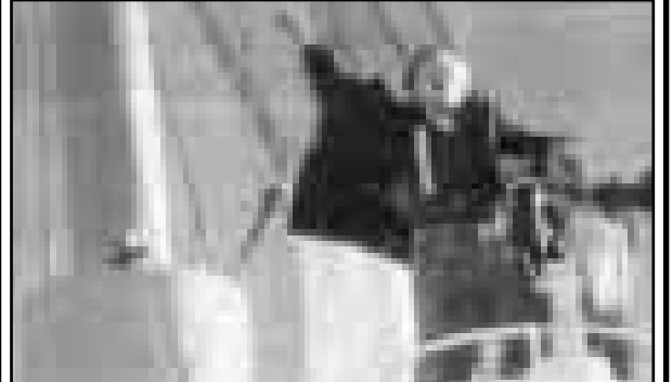
صحنه‌ای از فیلم تایتانیک

فیلم تایتانیک به کارگردانی «جیمز کامرون» با ۹۱۶ میلیون دلار فروش رکورد فروش را در تاریخ سینما شکست. گزارش واحد مرکزی خبر به نقل از خبرگزاری فرانسه از لس آنجلس حاکی است: فیلم تایتانیک به این ترتیب رکورد فیلم «بارک زوراسیک» به کارگردانی «استیون اسپیلبرگ» را که ۹۱۳ میلیون دلار فروش داشت، شکست. فیلم تایتانیک که از ۱۹ دسامبر بر روی پرده سینماها ظاهر شده است تا روز دوشنبه جمعاً ۴۰۲ میلیون دلار در بازار آمریکای شمالی و ۵۱۶ میلیون دلار در خارج فروش کرده است. این فیلم که بیش از ۲۰۰ میلیون دلار هزینه داشته است، در واقع گران‌ترین فیلمی است که در جهان ساخته شده است. انتظار می‌رود که فروش آن از یک میلیارد دلار فراتر رود.