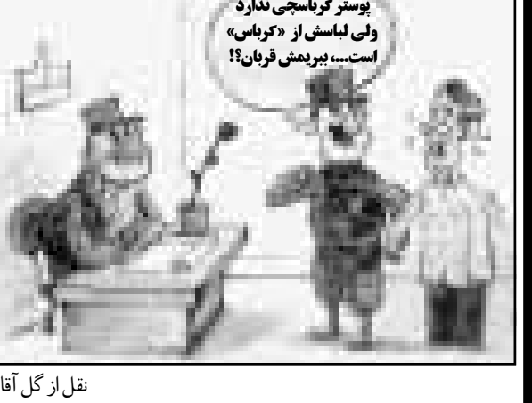
تقل از گل آقا

«بورانی در مورد بازرسی چند چاپخانه که چاپ روزنامه‌های همشهری، ایران و جامعه را به عهده داشتند گفت: آیا مأموران محترم در بند ناظران چاپ هم به دنبال بوستر و عکس آقای کرباسچی می‌گشته‌اند؟ - قدس