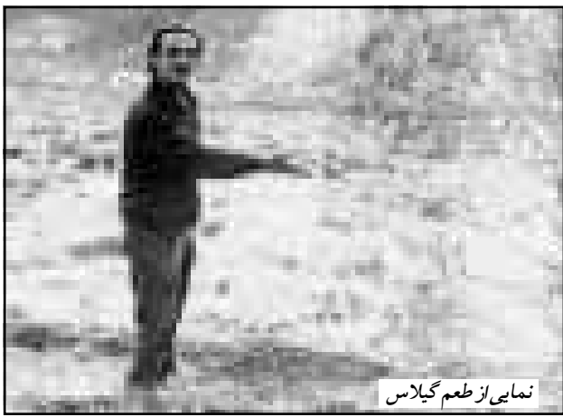
نمای از طعم گیلاس

و اما انسان بعدی بر خلاف طلبهٔ افغسانمی سن و سالی دارد و از صحبت‌هایش پیداست که اگر سواد