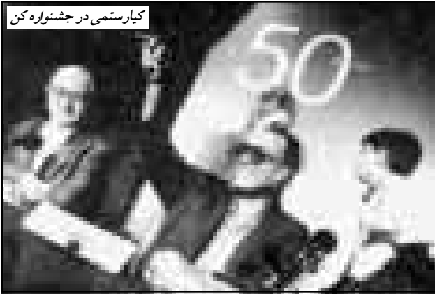
کیارستمی در جشنواره کن

بزرگ‌ترین بناهای سینمای جهان ۱ را بر ویرانه‌های ایرانی می‌سازد. . . . ۲ آنچه در طعم گیلاس حضور ی ولی گویا از شهر و شهرنشین و مشکلات آنها گریخته و به دامن طبیعت پناه آورده تا جاره در دش را در اینجا بچوید. آیا این بی‌زاری جستن به حدی است که باید خود را ناشناس دفن کند؟ که حتی مردانش را کسی نیابد؟ شاید در این فرار از اجتماع رازی نهفته است و شاید «از دیو و دد ملول است و انسانش آرزوست!» ۳ قهرمان کیارستمی اصلاً قهرمان نیست. کسی است مثل من و شما و آمده و به خاک می‌رود. خاک، همین