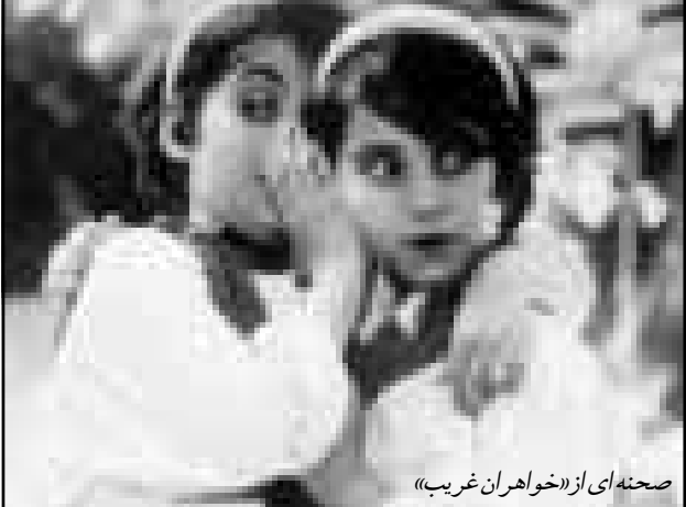
صحنه‌ای از«خواهران غریب»

- «ماهی بر خاک» ساخته مظفر شیدایی در جشنواره بین‌المللی فیلم زاگرب که از تاریخ ۲۷ تا ۳۱ خرداد در یوگسلاوی برگزار شد. - «قطره قطره آبشار» ساخته خسرو سبتمایی و «من و پرنده‌هایم» ساخته فرهاد مهرانفر در بیست و ششمین جشنواره بین‌المللی فیلم ملل که از تاریخ ۲۴ تا ۳۰ در اتریش برگزار شد. - فیلم‌های «وسری آبی» و «ترکس» ساخته رخشان بنی‌اتمداه، «لیلی بامن است» ساخته کمال تبریزی، «سارا» ساخته داریوش مهرجویی، «سفر» ساخته علی رضا رتسیمان، «بوی پیرانن یوسف» ساخته ابراهیم حاتمی کیا، «خواهران غریب» ساخته کیومرث پوراحمد در هفته فیلم