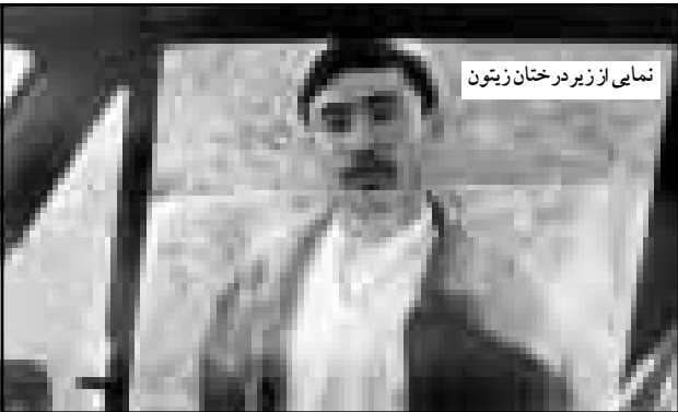
نمای از زیردرختان زیتون

معرفی می‌کند تا او را از سر خود باز کرده باشد. با آمدن شخصیت جدید، حضور مذهب کاملاً محسوس است. طلبهٔ افغانی می‌کوشد از طریق دین و دستورات نشأت گرفته از آن مشکل را (نه آن گونه که بدیعی می‌خواهد) حل کند و دالماً در بی‌منصرف کردن