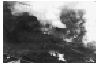
کشتی نرماندی در بندر نیویورک در آتش می‌سوزد

نرماندی، زیباترین کشتی مسافری جهان که پیش از جنگ «عروس آن لاتینک» لقب گرفته بود، در بندر نیویورک دستخوش حریق و به آهن پاره مبدل شد. این کشتی مسافری لوکس که میان اروپا و آمریکا رفت‌و آمد می‌کرد، پس از اشغال فرانسه توسط آلمان و روی کار آمدن حکومت ویشی، برای اینکه در اختیار هیتلر قرار نگیرد، در بندر نیویورک متوقف شدو اخیراً کنگره آمریکا مصوبه‌ای برای