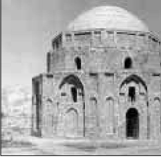
گنبدجبلیه (دوره سلجوقی)