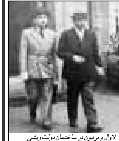
لاوال بر برترین در ساختمان دولت ویشی

جسید «بی بر لاول» وی عملاوه بر مقام نخست وزیری، سمتهای وزیر خارجه، وزیر کشور و وزیر اطلاعات را نیز شخصاً عهده دار است.