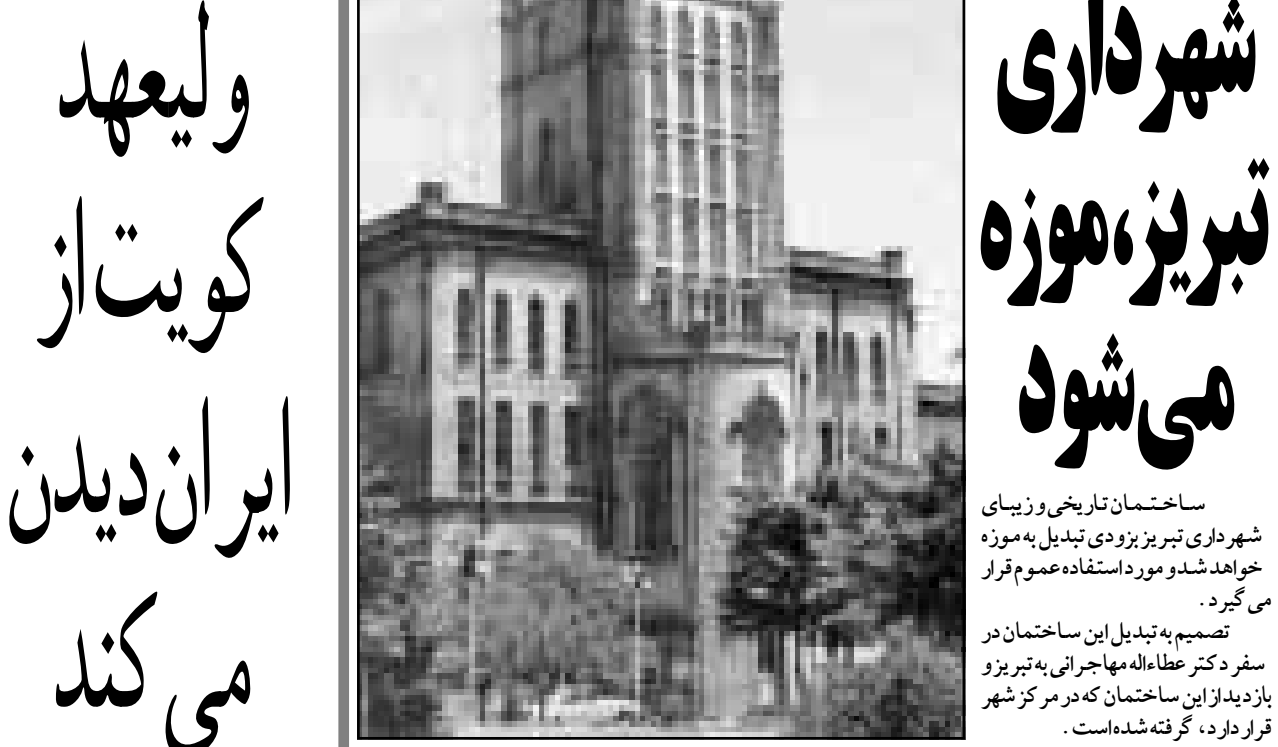
ساختمان تاریخی و زیبای شهرداری تبریز، موزه می‌شود

روزنامه «بنی آذربایجان» روز سه‌شنبه نوشت: شرکت‌های آمریکایی خواستار پایان دادن به تحریم اقتصادی ایران از سوی واشنگتن شده‌اند. این روزنامه نوشته است: واشنگتن مایل نیست تحریمی را که