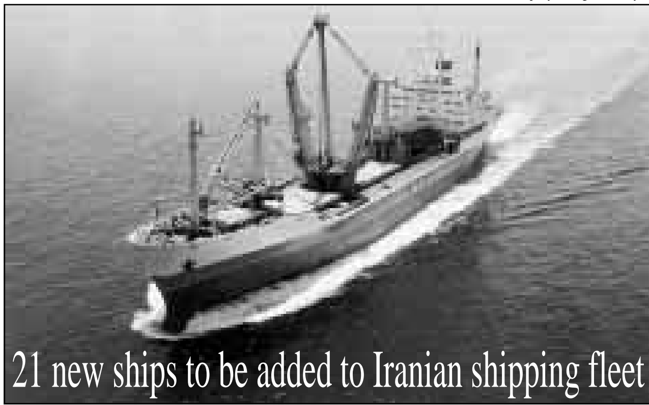
21 new ships to be added to Iranian shipping fleet

ously counter the perils of the nuclear weapons by ending the wild nightmare of the nuclear weapon in the region and that nuclear power countries needed to seriously show their concern effectively. Campbell on his part referring to the common views of Canada and the Islamic Republic of Iran, stated that his country is fully committed to the NPT and is ready to extend its cooperation with other countries aimed at further strengthening the implementation of the treaty. The Canadian deputy foreign minister said, "this country in principle agrees with the initiatives taken by the Islamic Republic of Iran, and that he expressed hope that the special group would be able to take effective steps in the direction of making NPT more credible." Zarif had earlier held meetings with several Canadian Foreign Ministry officials including the Foreign Ministry deputies in European and Middle Eastern and international affairs.