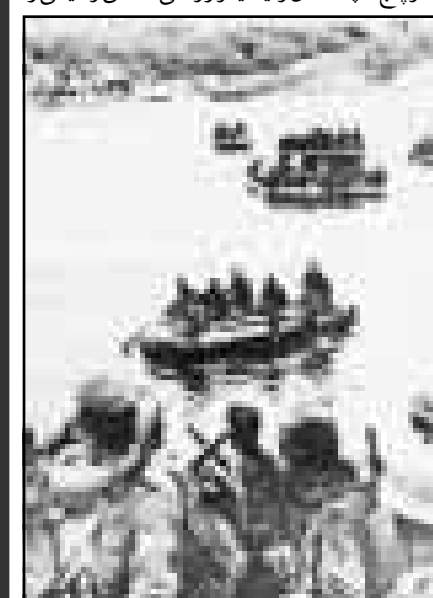
آلمانهادر حال عبور از رودخانه دن

اطرف رود «ولگا» شهر «استالینگراد» را مورد تهدید قرار دادند. ارتش سرخ با فون بلیتس در حال عقب نشینی است و پنج سیاه آلمان و رومانی وسیعی را