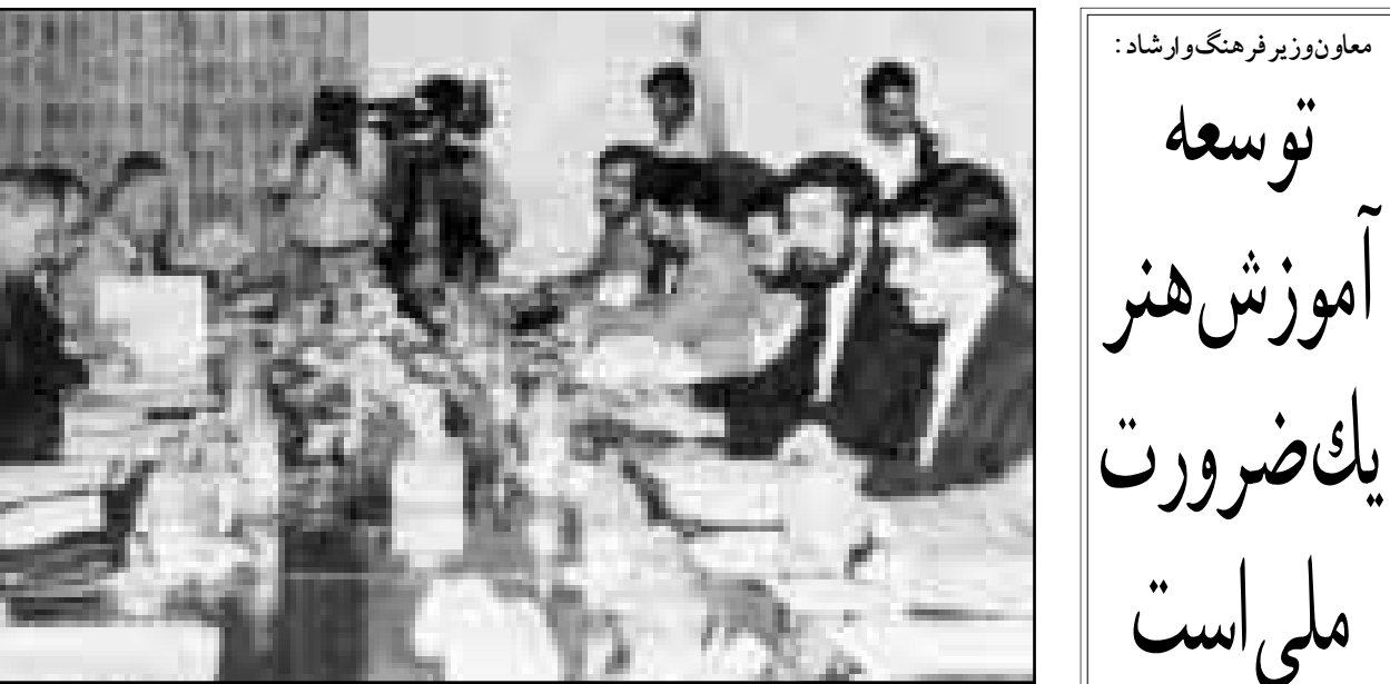
اعضای هیأت ایران (سمت راست) هنگام اولین دور مذاکره با هیأت اتحادیه اروپا در تهران

ایران: مسأله حقوق بشر باید در چارچوب ارزشها، فرهنگ و سنن هر کشور مورد توجه قرار گیرد