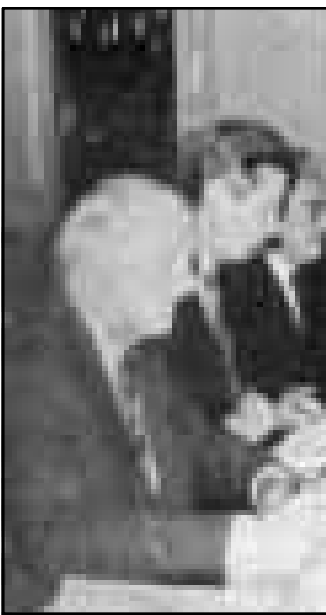
اعضای هیأت ایران (سمت راست) هنگام اولین دور مذاکره با هیأت اتحادیه اروپا در تهران

رئیس هیأت ترویکا: ایران و اتحادیه اروپا در باره موضوعات مطرح شده مطمئناً به نتیجه خواهند رسید.