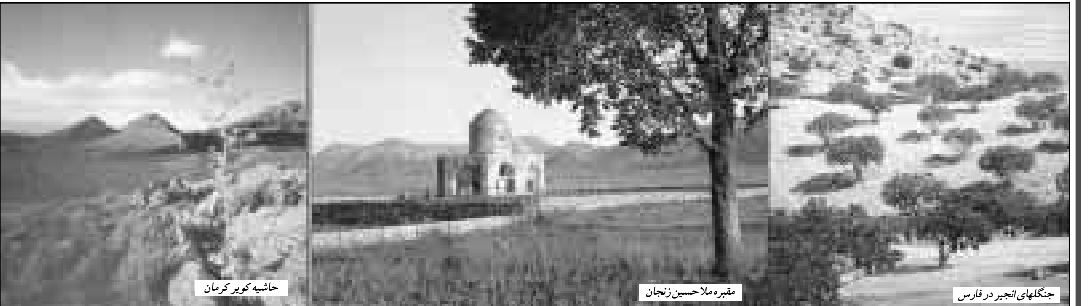
حاشیه کویر کرمان

به مویی بسته صبرم، نغمهٔ تار است پنداری دلم از هیچ می‌رنجد، دل پار است پنداری به تحریک نسیمی، خاطرم آشفته می‌گردد به خودرایی سرزلفین دلدار است پنداری جنانم می‌گزد بی‌و، تماشا نشای چمن کردن که شکل غنچه بر گلبن، سر مار است پنداری ننوشم تا قدح، بر من دری از غیب نگشاید کیسه روزم در دست خمیار است پنداری به طعن طعن مردم را هدف گشتم که دامانم ز سنگ کودکان دامان کهمسار است پنداری فلک را دیده‌ام برهم نمی‌آید شب از کینتم چنان هشیار می‌خواید، که پیدار است پنداری «ظنری» بس، تو خوش شیرین و نازک نمکه می‌گویی تو را شکر به دامان، گل به خروار است پنداری نظری نیشابوری