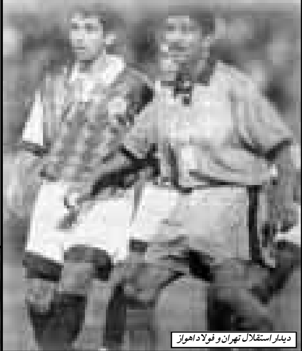
دیدار استقلال تهران و فولاداهواز