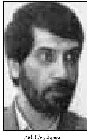
محمد رضا باهنر

پاسخ نماینده جناح راست درباره احتمال استیضاح وزیر فرهنگ و ارشاد • ما با آقای مهاجرانی یک سری اختلاف داریم • وزیر سابق کشور تعویض فرمانده نیروی انتظامی و فرمانده حفاظت را خواسته بود