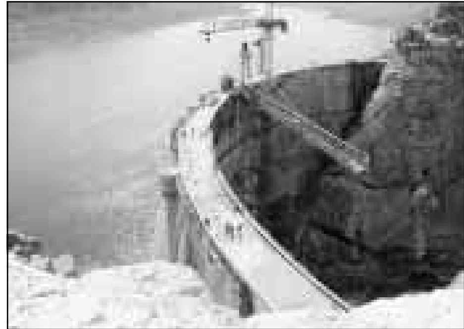
water supply projects. In the first and second five-year development plans water projects received nine percent of the total budget, he said, adding that in the post-revolution era, 60 huge dams have been constructed in the country. Zargar said that by the end of the current year on March 21, seven dams with a capacity of 1.250 million cubic meters and 70,000 hectares irrigation capacity will be completed. 'Onligh' dam is high reservoir dam the construction operation of which was started early 1996. It will supply water for 400 hectares of farming lands in 'Onligh' in Miyaneh.

TABRIZ - Some 70 huge dams are under construction across the country which, when operational, will provide 20 billion cubic meters of water, it has been announced here. Speaking at the inauguration ceremony for 'Onligh' reservoir dam in 'Onligh' village in Miyaneh, Deputy Minister of Energy for water affairs, Zargar said that the dams, whose allotted budget exceeds Rls 30,000 billion, will become operational by the end of the Third Five-Year Development Plan, IRNA reported. According to Zargar, irrigation systems are being installed in an area of 760,000 hectares of farming lands and they will also become operational by the end of the Third Development Plan. He said that due to the scarcity of rainfalls which is due to the geographical location of the country, the government should invest more than ever in