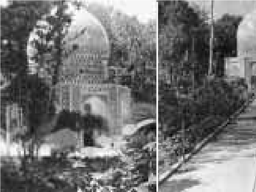
بقعه شهید شیخ فریدالدین عطار

تو اگر صاحب نوشی و اگر ضارب نیش دیگران راست که من بی‌خبرم بانو زخوش به چه عضو تو زند بوسه؟ نداند چه کند بر سر سفره سلطان جو نشیند دروش همه در خور دوصال تو و من از همه کم همه حیران جمال تو و من از همه پیش می‌زنی تیغ و ندانی که چه سان می‌گذرد گرگ در گله ندارد خبیر از حالت میش آخر این قوم چه خواهند ز جانهای فگار؟ آخر این جمع چه جویند ز دل‌های پریش؟ به‌ر می‌روم آسا به هزاران امید قدمی می‌نهم آسا به هزاران تنوشی رف «جمبر» به در شاه، بگو گردون را هر چه کردی به من آید پس از اینت در پیش مجمر اصفهانی