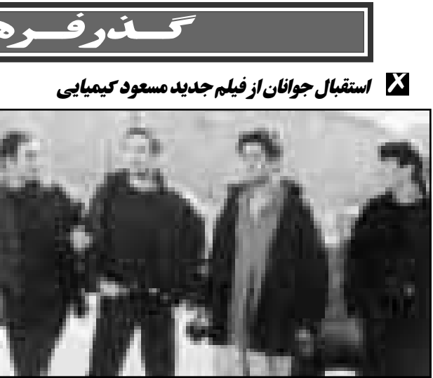
صحنه‌ای از فیلم «مردسدا»

وی گفت: این تصمیم دنبینال شیوع مجدد جنون گاوی در هلند، اتخاذ کرده‌است. روزنامه تلگراف چاپ هلند در یکی از شماره‌های اخیر خود با اشاره به شیوع بیماری جنون گاوی در این کشور نوشت، کشف مورد جدید شیوع جنون گاوی در دهکده فرسرخلو واقع در شمال هلند، ضربه شدیدی برای بخش دامداری هلند محسوب می‌گردد.