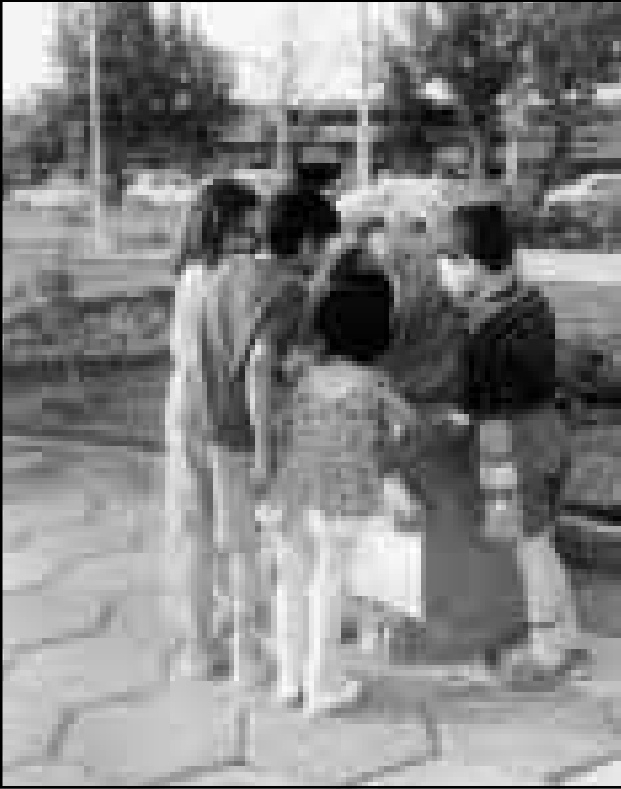
در زمان زندگی جنینی، پسر خیلی سریعتر از دختر رشد می‌کند، سبک‌تر و بلندتر از دختر است و این روند تا هفت ماهگی ادامه می‌یابد.

نیاز پسرها به کالری بیشتر از دخترهاست. پسرها ماهیچه‌هایی قویتر از دخترها دارند. پسرها اکسیژن بیشتری در خون دارند و دوره استراحت قلب آنها کوتاهتر از دوره استراحت قلب دخترها است. از نظر رشد قد و وزن نیز پسران بر اساس مطالعات تا ۱۰ الی ۱۱ سالگی، پسرها بر دخترها برتری دارند و از ۱۰ تا ۱۵ و ۱۶ سالگی، دخترها جلو می‌افتند و پس از آن پسرها برتری در قد و وزن پیدا می‌کنند.