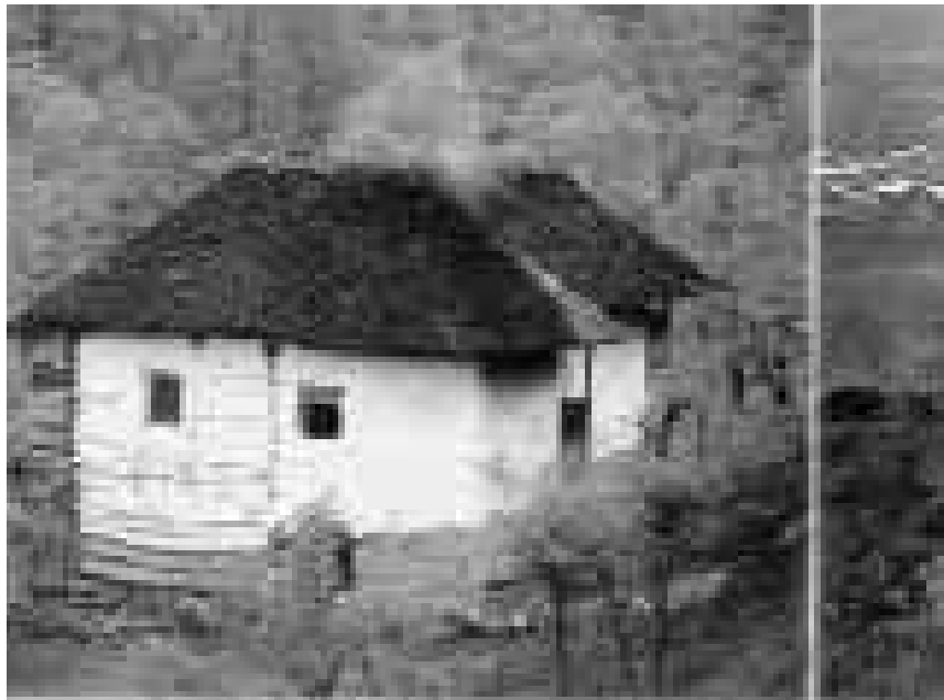
ملازندان نما می‌از دهکانه زیارت و کلبه‌ای در نزدیکی بابلی

مالمیریان گفت: تمامی اقدام‌های مربوط به تهیه نقشه، تعیین خطوط، جنس کف دریا، غلظت، چگالی و درجه حرارت آب و همچنین تشخیص جریان‌های آبی توسط کادر فنی سازمان جغرافیایی مستقر در این شناور انجام‌می‌شود. وی با اشاره به اهمیت آبر استراتژیک خلیج فارس در اقتصاد، امنیت و بازرگانی کشورهای منطقه، آژوم همکار ی کشور های این حوزه در امر خصوص تهیه نقشه‌های هیدروگرافی مورد تأکید قرار داد.