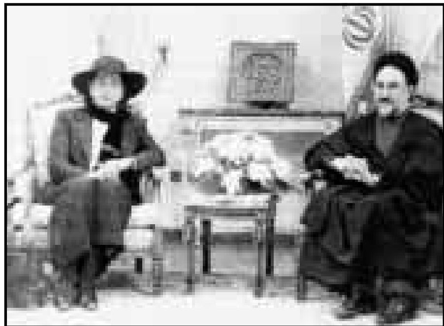
خاتم پاپا ند رتو وزیر توسعه یونان در ملاقات با آقای خاتمی رئیس جمهور

ایران و یونان از همکاریهای ترکیه و اسرائیل نگران هستند یونان می تواند واسطه میان ایران و اروپا و ایران می تواند واسطه میان یونان و کشورهای منطقه باشد