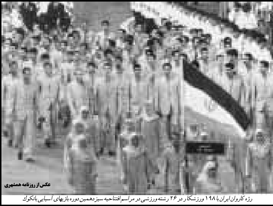
رژه کاروان ایران با ۱۹۸ ورزشکار در ۲۶ رشته ورزشی در مراسم افتتاحیه سیزدهمین دوره بازیهای آسیایی بانکوک

شدند. در نخستین دیدار تیم چین یکی از ۳ قطب برتر والیبال آسیا و از امیدهای قهرمانی این یکبارها در ۳ کیم ییلی و با امتیازهای ۱۵ بر ۱۵٫۹ و ۷ و ۱۱ از سد تیم هند گذشت. تیم کره جنوبی در دیدار بعدی به مصاف تیم قطر رفت و این تیم را با نتیجه ۳ بر صفر و با امتیازهای ۱۵٫۳ بر ۱۵ و ۷ و ۱۵