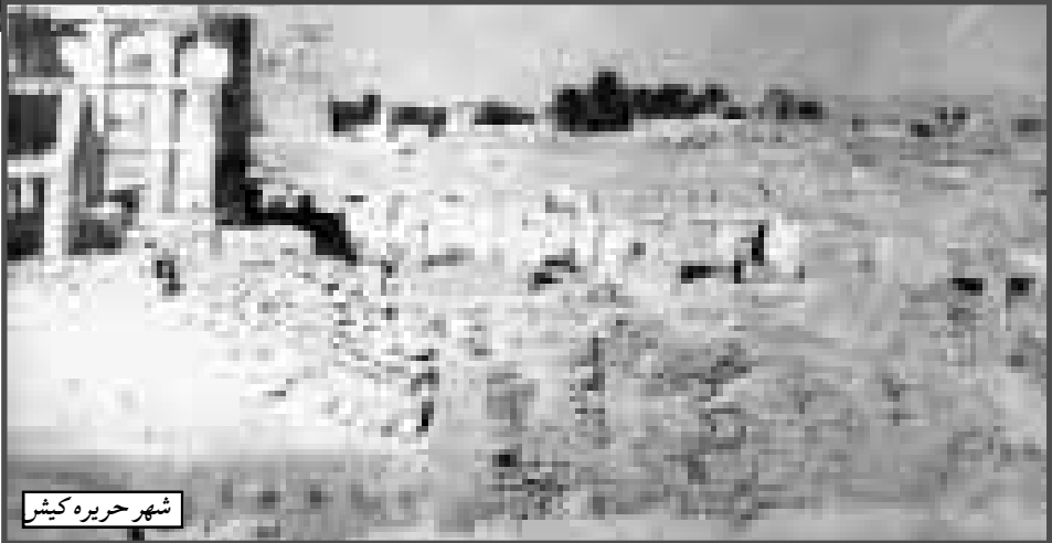
شهر حریره کیش

بناهایی که در فهرست آثار ملی ثبت شده قلعه هرمز، منزل فکری،