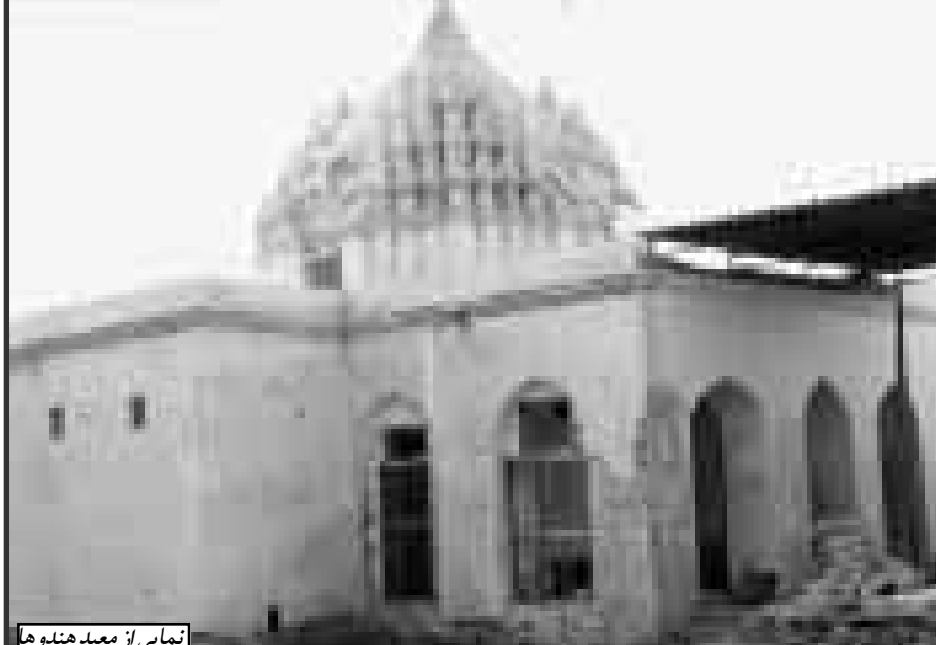
نمای از معبد هندوها