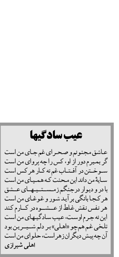
عیب ساد گیها

عاشق مجنونتم و صحرای غم جای من است گر بمیرم دور از او، کس را چه پروای من است سوخنتن در آفتاب غم نه کنار هر کس است سایهٔ من داند این محنت که همبای من است با در و دیوار در جنگم زمستیهای عشق هر کجا بانگی بر آید شور و غوغای من است هر نفس نقش غلط از عشوه در کارم کند این نه جرم لوست، عیب ساد گیهای من است تلخی غم هم چو «اهلی» بر دلم شیرین بود آن چه پیش دیگران زهر است، حلوا ی من است اهلی شیرازی