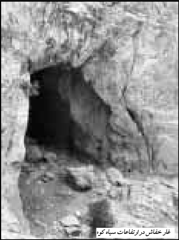
غار خفاش در ارتفاعات سیاه کوه

هزار و ۱۵۰ هکتارو اعتبار شش میلیارد و ۲۰۰میلیون ریال در دست اجرا است.