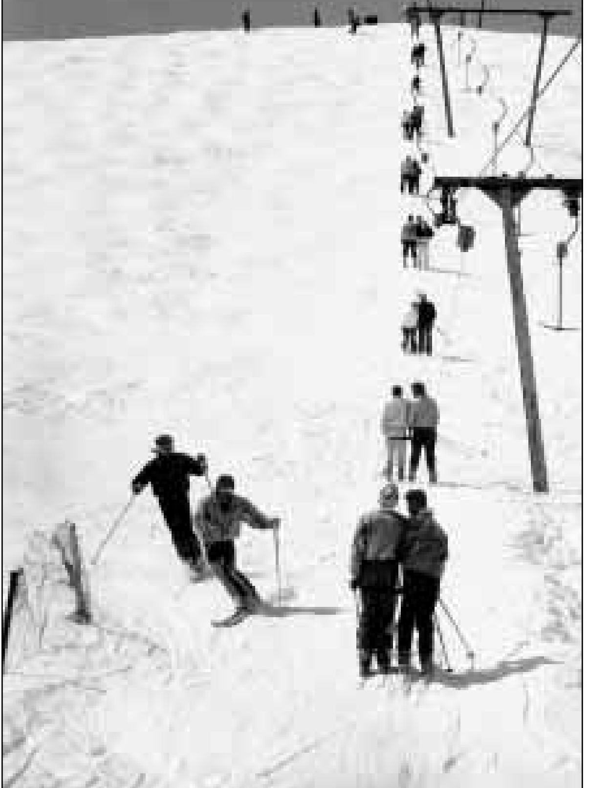
تهران- پیست اسکی دیزین