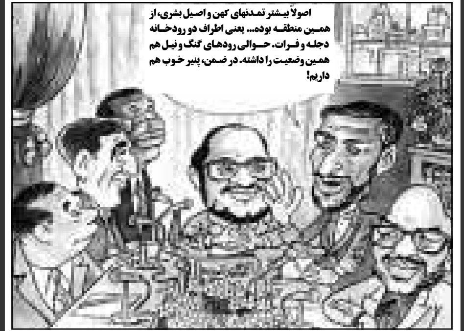
به نقل از: گل آقا