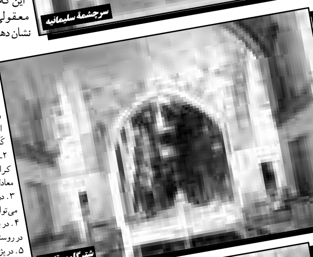
شهر گلوی تاجار