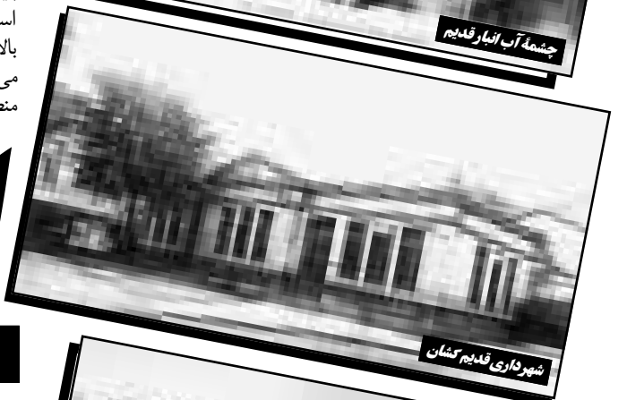
شهر تاریخی قدیم کشان