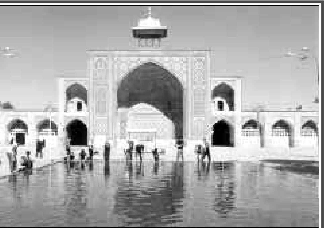
قزوین - ایوان شمالی مسجدالدینی

کسان مشاهده‌بازاری‌بین برده‌نشین باشند خیابان سعدی: یکی از خیابانهای مرکزی کشان خیابان کارنو (Carnot) است، که بایستی سعدی کارنو (Sadi Carnot) باشد. در بیشتر شهرهای فرانسه،