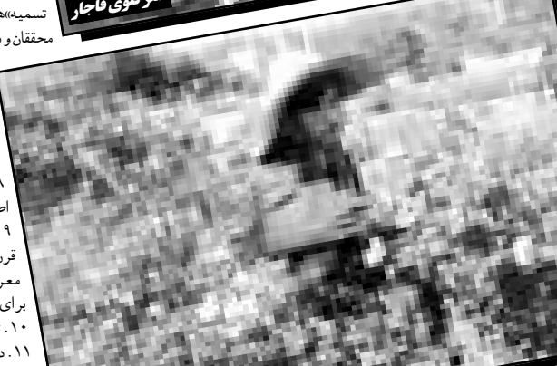
گل‌های قمصر کاشان