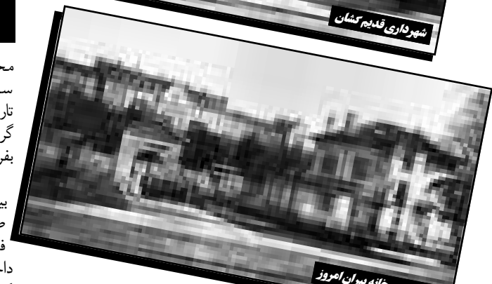
تاج قدیم - خانه بیرون اموز