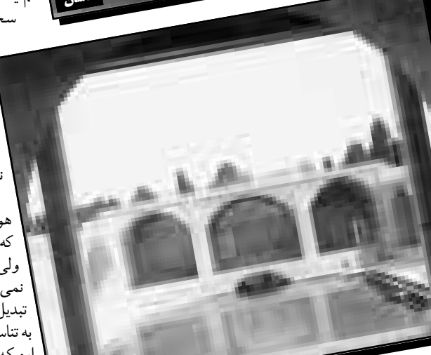
حرم چشمه سلیمانیه