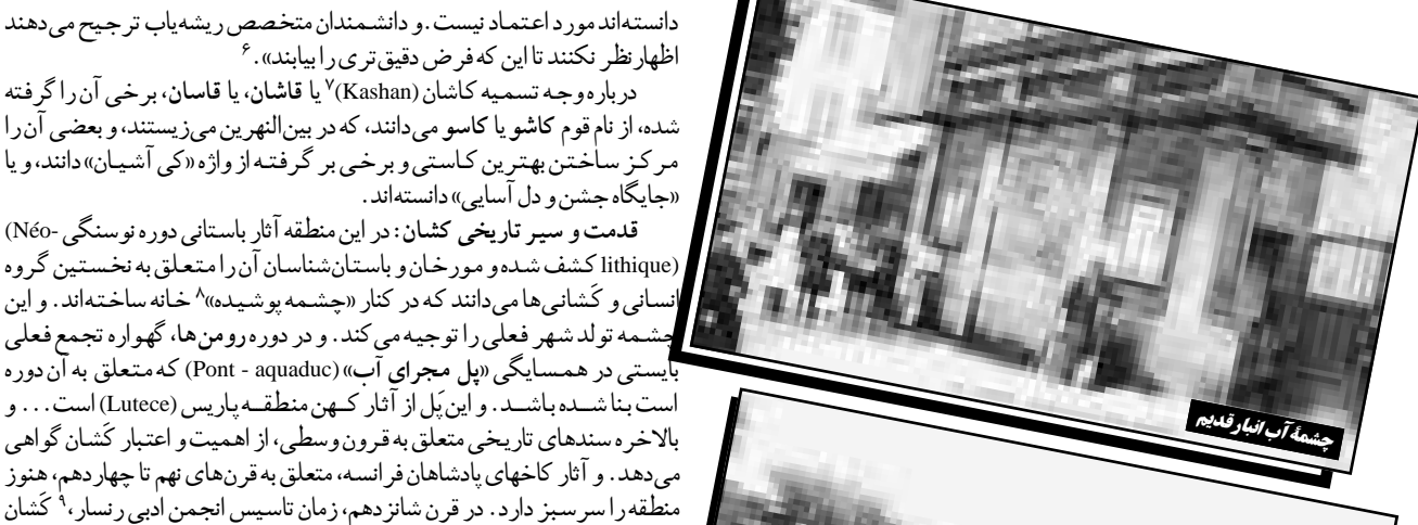
جمله آب انبار قدیم