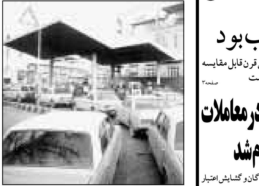
قیمت بنزین در سال آینده لتری ۳۵۰ ریال پیشنهاد شد

نایب رئیس کمیسیون امور نفت مجلس اعلام کرد: کمیسیون اصلی رسیدگی کننده به لایحه بودجه سال ۷۸ کل کشور در مجلس قیمت بنزین را برای سال آینده لتری ۳۵۰ ریال تعیین کرده است. احمد ناطق نوری گفت: تعیین این مبلغ خواهد شد. این بانک تصریح کرد: کمیسیون اصلی رسیدگی کننده به لایحه بودجه پس از انجام بحث‌های کارشناسی متعددی انجام شده است و ولی این مصوبه باید در جلسه علنی مجلس مورد رسیدگی قرار گیرد و پس از تصویب در مجلس قابل اجرا است. نایب رئیس کمیسیون امور نفت مجلس گفت: کمیسیون اصلی رسیدگی به لایحه بودجه همچنین برای سال آینده قیمت هر لیتر نفت و نفت و لیل را ۱۰۰۰ ریال و قیمت هر لیتر نفت کوره را ۵۰۰ ریال تعیین کرده است. احمد ناطق نوری که نماینده شهرستان نون مازان است افزود: پیشنهاد دولت و پیشنهادهای دیگر درباره قیمت بنزین به دلایل مختلف از جمله ایجاد تورم و گرانی در کمیسیون