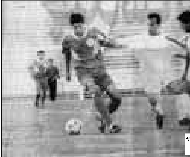
نجر در بازی با بانک ملی دو بر یک به پیروزی رسید