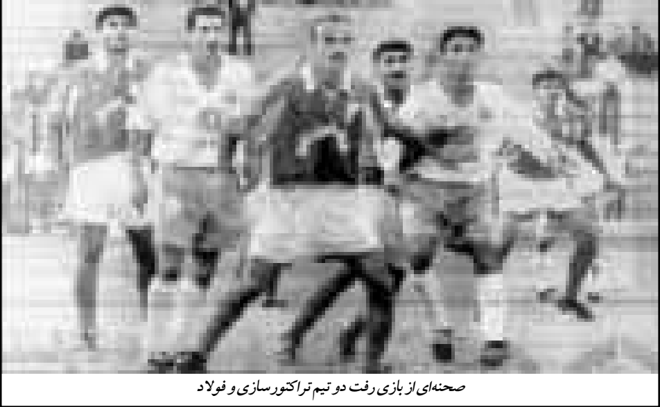
صحنه‌ای از بازی رفت دو تیم تراکتور سازی و فولاد