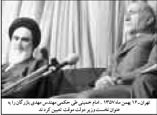
تهران- ۱۶ بهمن ماه ۱۳۵۷ - امام خمینی طی حکمی مهندس مهدی بازرگان را به عنوان نخست‌وزیر دولت موقت تعیین کرد

خبرنگار سیاسی اطلاعات که در جریان این تلاش‌ها بود توانست از تشکیل يك جلسه محرمانه بین امام، و اعضای شورا، نخست‌وزیر احتمالی منتخب امام و تنی چنداز مشاوران اطلاع پیدا کند.