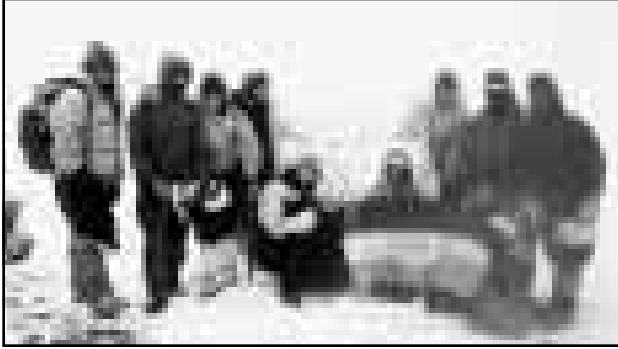
دالانکوه صعود کنند.

گفتنی است، این صعود سراسری که اولین حرکت گسترده کوهنوردی دانشجویی بود، با حمایت و پشتیبانی معاونت فرهنگی جهاددانشگاهی تهران با دو تیم مجزای آقایان خانمها و با تعداد بیش از ۵۰ نفر شرکت داشتند.