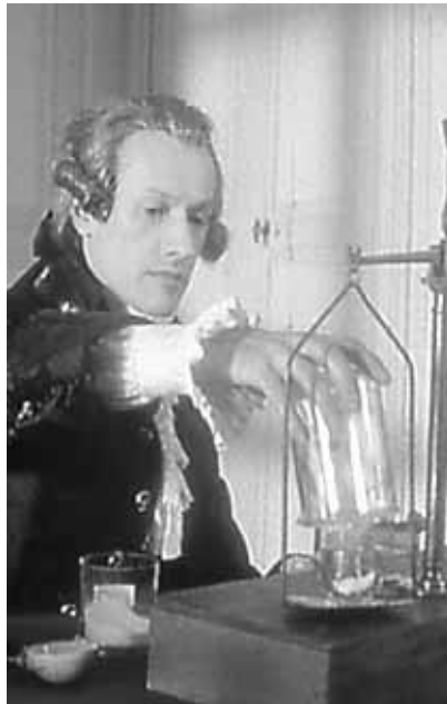
La naissance de la chimie scientifique dans les œuvres de Lavoisier (diffusion prévue : samedi 2 août).

Ce premier volet revisite la légende de ces trois personnages qui ont en commun une fin tragique et resti-