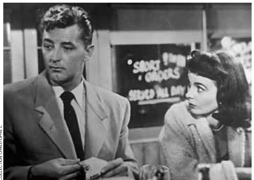
Robert Mitchum et Jean Simmons dans « Un si doux visage »

Une communauté de catholiques très pratiquants vit