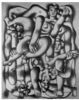
MINA/CENTRE GEORGES POMPIDOU, PARIS