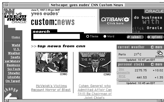
La « Une » du journal personnalisé

CustomNews possède d'autres atouts. Tout d'abord, il est réellement multimédia : en plus des textes d'articles, il propose des extraits de reportages vidéo empruntés à CNN Television. Par ail-