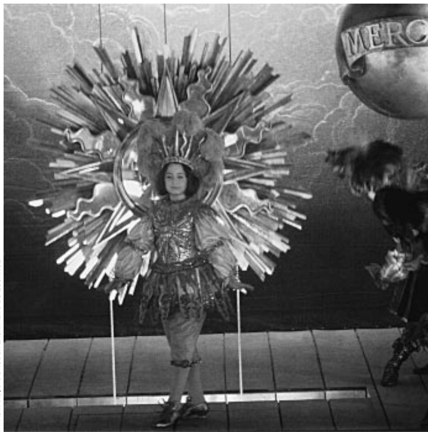
F. PAUMARD, J. DONOSOFLASHFILMS DU LOSANGE

Chronique historique, récit initiatique, deux heures quarante d'événements en cascade, intrigues politiques, ambitions