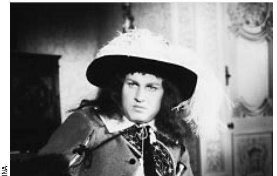
La Prise du pouvoir par Louis XIV, de Roberto Rossellini