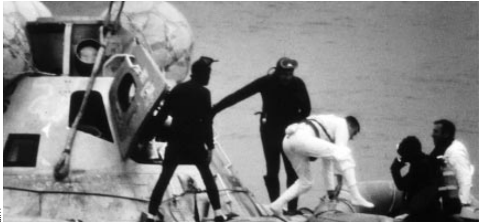
Haise, Lovell et Swigert lors du retour d'Apollo XIII

Etat d'apesanteur (mardi) montre qu'on peut par-