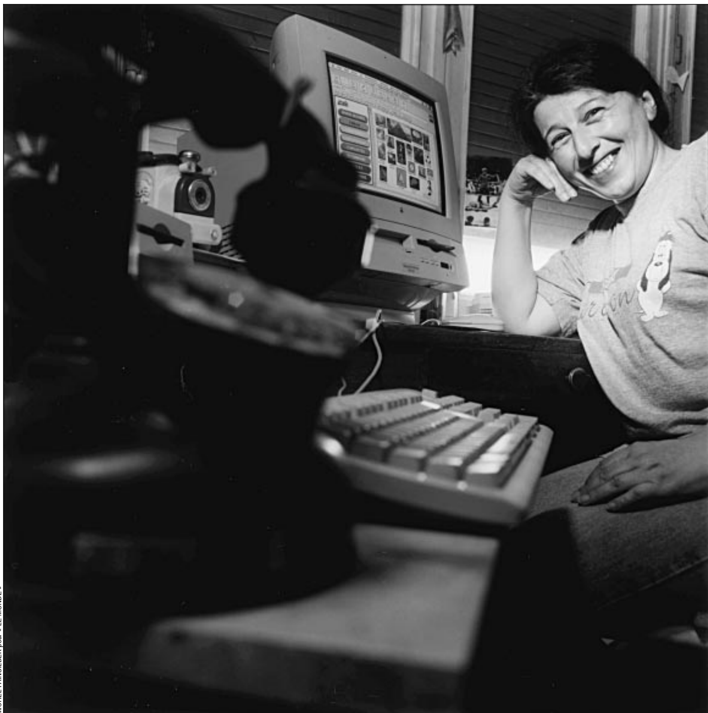
MICHEL FAINSILBER pour « LE MONDE »

Actif, retraité, père ou mère de famille. Sous leur apparence classique, ils cachent une passion... pour Internet. Pourquoi ? Comment ? A partir de cette semaine et jusqu'au 31 août, le portrait de six utilisateurs avertis du réseau des réseaux, devenus acteurs. Interactivité oblige ! Première de la série, une institutrice qui révèle les trésors du Web aux enfants