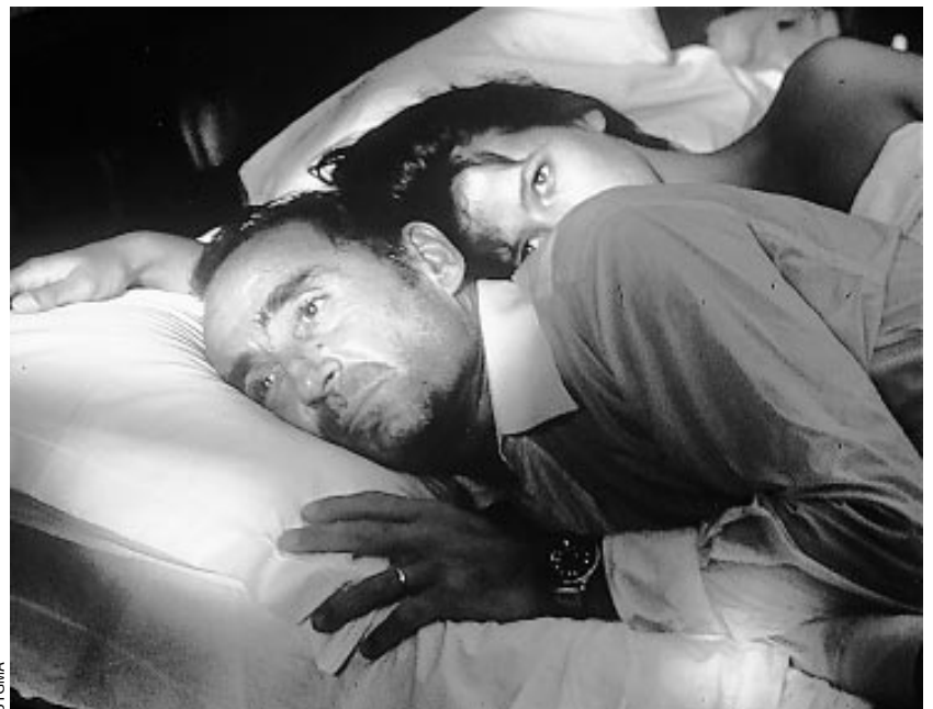
Descente aux enfers, de Francis Girod

Une femme très âgée qui pratique l'arnaque de haute volée s'éprend d'un garçon de plage rencontré à