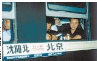
Ci-dessus le Congo ; ci-contre : la Chine

tude pour mener leur exploration du pays plus en profondeur, les contraint aussi à relancer l'intérêt à mi-parcours. Et, au gré des circonstances – le chemin de fer n'occupant pas partout une place prépondérante –, le train perd parfois de son importance, devenant plus un vecteur qu'un acteur, tout en conservant sa fonction de « personnage récurrent ».