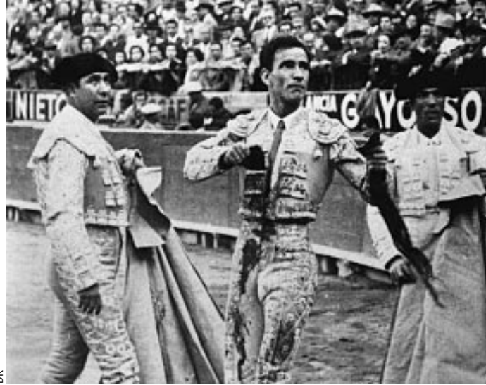
Un film sur la folie du double