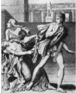
BIBLIOTHÈQUE DE L'OPÉRA