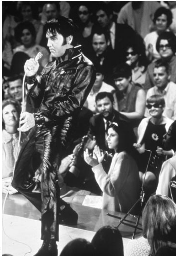
Le Comeback Special de 1968

télévision. Celle d'Hollywood aura été d'enfermer cette personnalité animale dans la cage des nanars formatés. A l'exception peut-être de Jailhouse Rock (Le Rock du baigne) , King Creole , Flaming Star (Les Rôdeurs de la plaine) et Wild in the Country (Amour sauvage) , les films d'Elvis Presley ont vulgarisé et policé la sensualité du musicien, quand la « platitude » télévisuelle la saisissait à vif. Est-ce un hasard si c'est la télévision – le Comeback Special diffusé