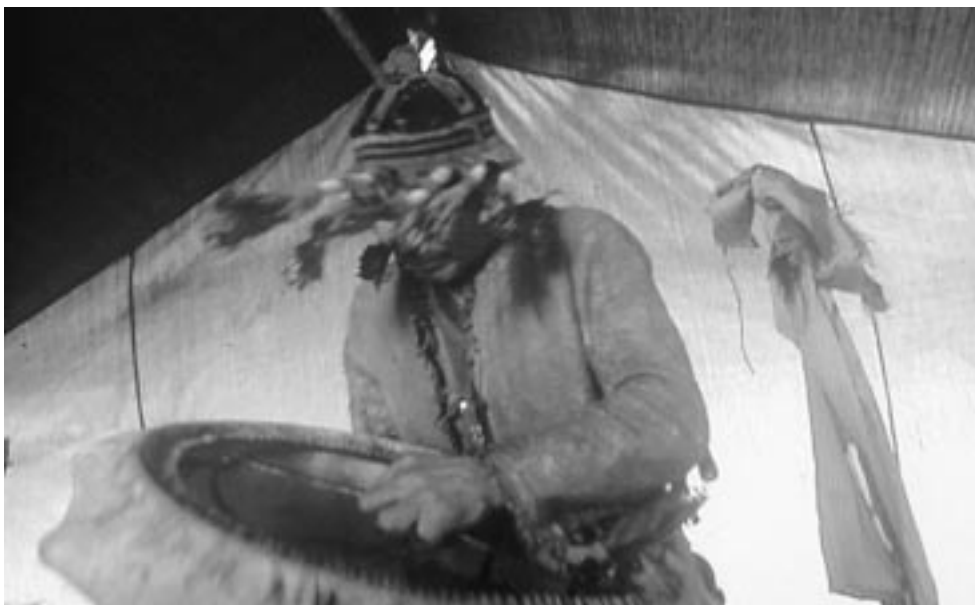
ADR PRODIFRANCE 3