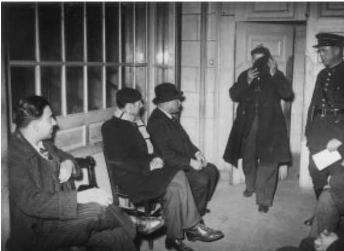
1938, des cagouleurs inculpés pour trafic d'armes