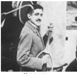
ASSOCIATION DES AMIS DE PROUST