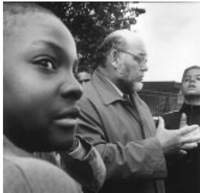
Robert Hue en campagne, à Bezons (Val-d'Oise), lors des élections législatives de mai-juin 1997

Ledit artifice permet en tout cas de voler quelques amusants apartés. Au