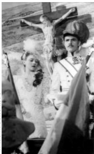
Edwige Feuillère et John Lodge

Interrompu par la mobilisation, repris et terminé au début de 1940, le film sortit le 1 er mai de cette année-là pour une brève exclusivité. Les circonstances défavo-