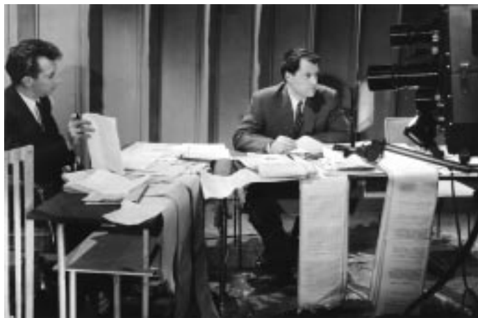
Première apparition à l'image des présentateurs du JT, Jacques Perrot et Georges de Caunes, le 8 novembre 1954

– Comment avez-vous travaillé avec l'INA ? Quelles sont vos sources ?