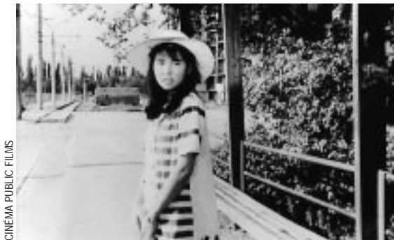
« Kairat »

Dans ce récit d'apprentissage d'une vie simple, Omirbaev force l'admiration par sa maîtrise, son sens accompli du cadrage et sa manière d'insérer avec un formidable naturel les rêves de son double dans la réalité. Il ne cède à aucun effet facile et sait étonnamment traduire par l'ellipse le temps qui passe.