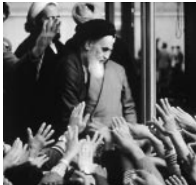
Khomeiny saluant la foule à l'école Refah