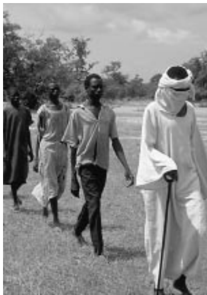
En chemin vers l'esclavage au service des grandes familles du Nord

Face à l'inaction de la communauté internationale qui se contente de larguer