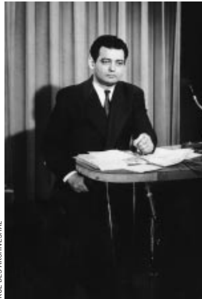
RUE DES ARCHIVISTAL