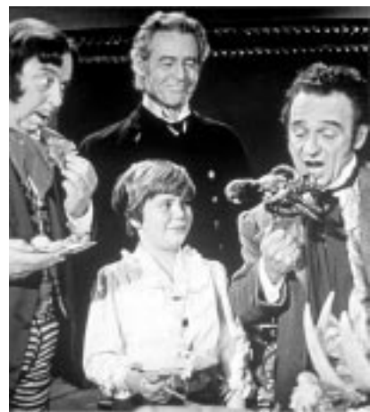
«Capitaine Nemo et la ville sous-marine»

Film norvégien. Kjell Sundvall (1997). Avec Mikael Persbrandt, Michael Kitchen.