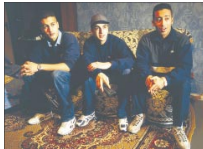
La télé, les jeunes, les cités

ANGLETERRE-FRANCE Nos champions du monde affrontent les Anglais à Wembley. Page 38