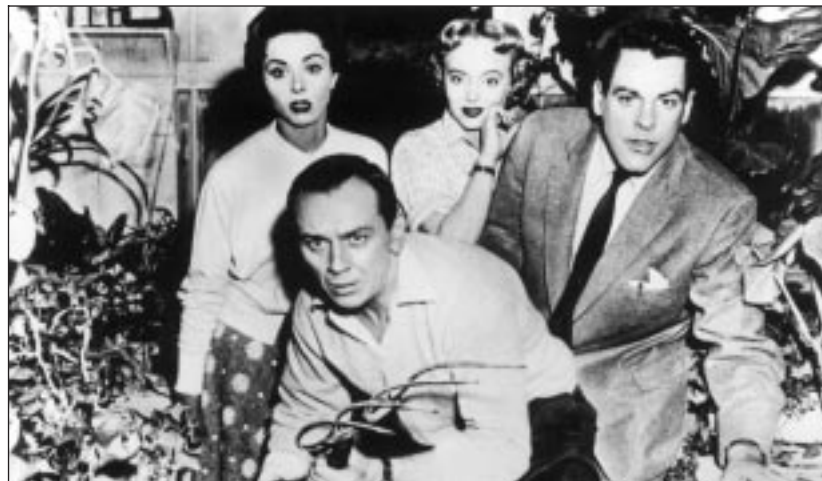
« L'Invasion des profanateurs de sépultures »

Il a un visage rond comme une bille, et pas un cheveu sur le crâne, d'où son nom. Issu de l'imagination de deux Québécoises, Christine L'Heureux et Hélène Desputeaux , Caillou, créé en 1990, a immédiatement conquis le public des tout-petits. Ces petites histoires écrites dans le but d'aider les enfants à grandir, publiées par les éditions Chouette, ont fait le tour du monde. Adaptés pour la télévision par la société de production canadienne Cinar, les aventures de Caillou ont été diffusées sur Canal J et sur La Cinquième. Elles sont aujourd'hui disponibles en vidéo : six cassettes regroupant chacune onze petites histoires de cinq minutes. L'animation est fidèle à l'œuvre originale et l'illustration sonore particulièrement soignée. – S. Ke. ■ 6 cassettes, couleur, v.f., 55 min. chacune, Cinar-Alpa média, 99 F (15,09 €) l'unité. (Prix indicatifs.)