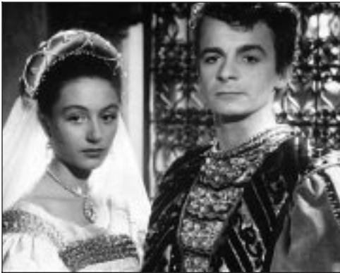
Anouk Aim e et Serge Reggiani dans « Les Amants de V rone »,   20.30 sur Cin  Classics

13.25 Cin  Classics 36429432 Howard Hawks. Avec Gary Cooper (Etats-Unis, 1941, 135 min) ◊. Un fermier antimilitariste du Tennessee devient un h ros de guerre.