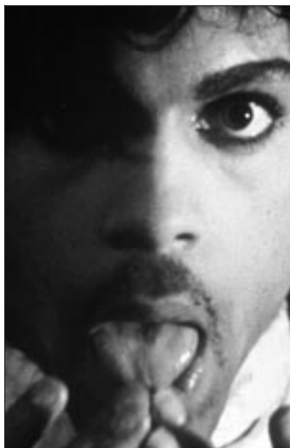
Prince dans « Purple Rain », à 22.25 sur Canal Jimmy