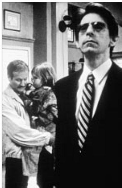
Un nouvel épisode de la série « Homicide », à 20.40 sur Série Club