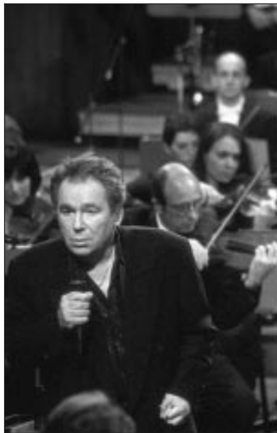
Claude Nougaro aux « Quatre Saisons à Toulouse », à 20.45 sur Mezzo