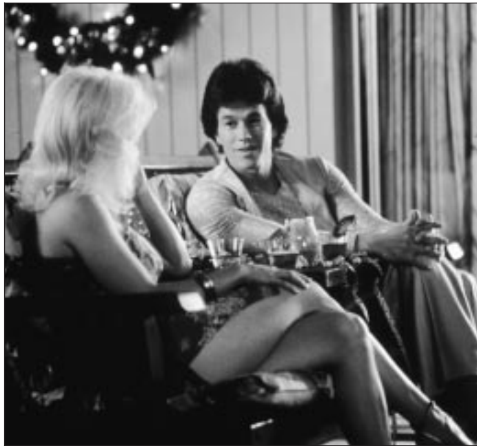
Mark Wahlberg dans « Boogie Nights »