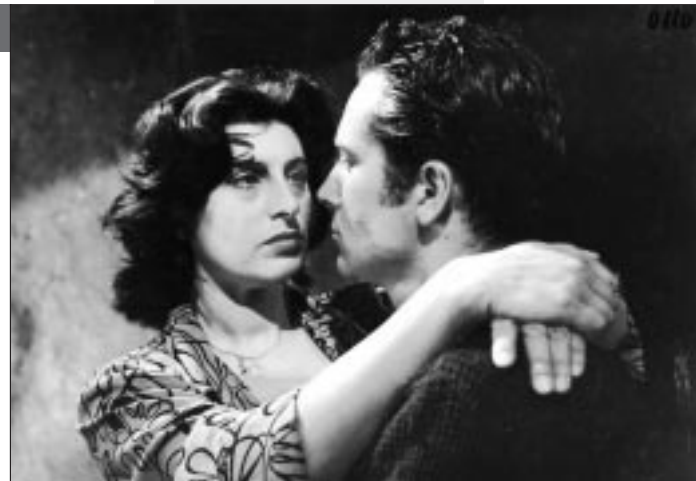
Anna Magnani et Rossano Brazzi

Ce fut, aussi, une histoire d'amour. En 1947, Rossellini célébrait La Magnani dans le dyptique d' Amore : La Voix humaine , de Jean Cocteau et Le Miracle , sur un scénario de Fellini. Et, deux ans après, ils étaient séparés. Ingrid Bergman avait pris la place d'Anna Magnani dans la vie et l'œuvre de Rossellini. Celui-ci conçut Stromboli pour