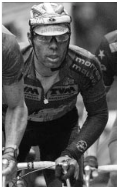
Cyclisme : Milan-San Remo, en direct à partir de 15.45 sur Eurosport