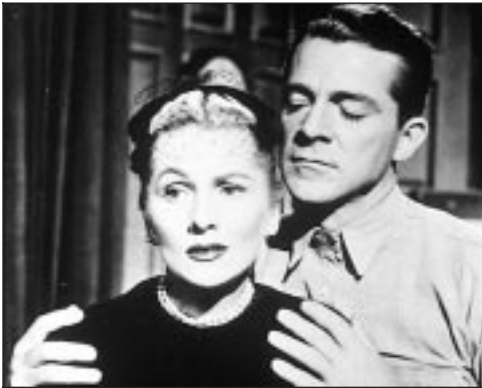
Joan Fontaine et Dana Andrews dans « L'Invraisemblable Vérité », à 21.55 sur Cinétoile

UNE ÉTOILE EST NÉE ■■■ 11.25 Ciné Cinéma 1 81817697 0.15 Ciné Cinéma 2 509164524 George Cukor. Avec Judy Garland (Etats-Unis, 1954, 145 min) ○ . Un acteur alcoolique et vieillissant s'éprend d'une jeune chanteuse et fait d'elle une vedette.