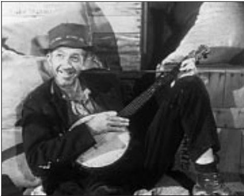
« Saint Louis Blues », une comédie musicale de John Cromwell à 11.15 sur Ciné Classics

YANKS ■■ ■■ ■■ 9.20 Ciné Cinéma 2 523193285 2.45 Ciné Cinéma 3 550962155 John Schlesinger. Avec Richard Gere (Etats-Unis, 1979, 140 min) \diamond . Amours de guerre dans l'Angleterre churchillienne.