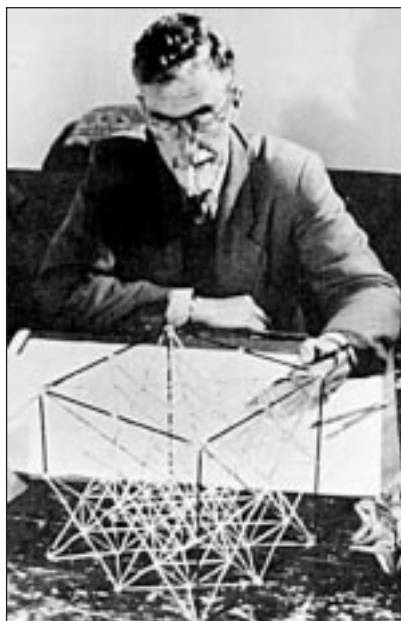
M.C. Escher, l'art de jouer sur l'illusion optique, à 20.55 sur Odyssee