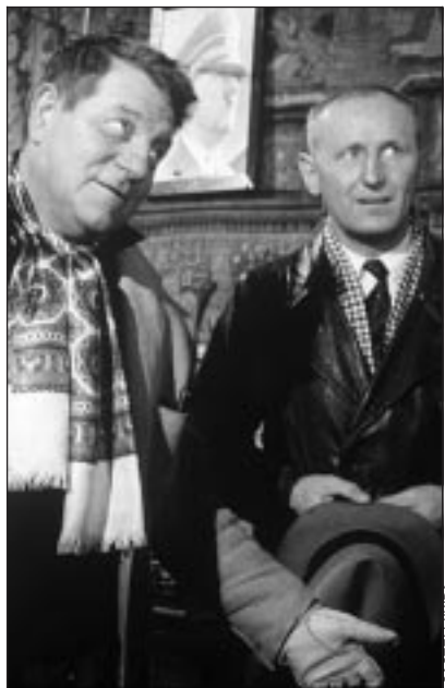
Jean Gabin et Bourvil dans « La Traversée de Paris », à 22.15 sur TV5