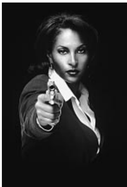
Pam Grier dans « Jackie Brown »

En adaptant un roman crépusculaire d'Elmore Leonard, son auteur favori, Tarantino rend d'abord hommage aux films de la « blaxploitation », le cinéma noir des années 70, et à leur égérie, Pam Grier, à laquelle il offre, en quelque sorte, le même « lifting » professionnel qu'à John Travolta dans Pulp Fiction . Elle incarne magnifiquement le rôle-titre d'une hôtesse de l'air de quarante-quatre ans qui arrondit ses fins de mois en convoyant de l'argent sale pour un petit trafiquant d'armes (Samuel L. Jackson). Arrêtée, elle accepte de coopérer avec la police pour piéger son commanditaire et échapper à la prison. Mais, à l'insu des deux parties, elle monte un stratagème pour tirer son épingle du jeu – et accessoirement un demi-million de dollars –, avec la complicité d'un prêteur de cautions tombé