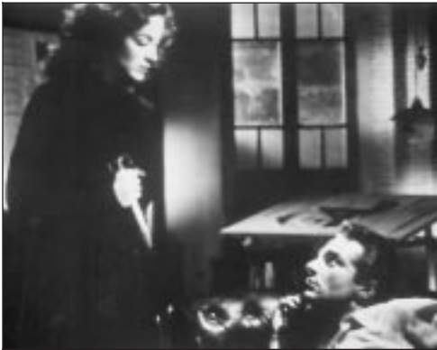
COLLECTION CHRISTOPHE L.

LE CRABE-TAMBOUR ■ ■ ■ 8.00 Ciné Cinéma 3 505386512 Pierre Schoendoerffer. Avec Jean Rochefort (France, 1977, 115 min) ⊖ . Un vieil officier de marine malade se porte à la rencontre d'un ami d'antan et médite sur leurs destins.