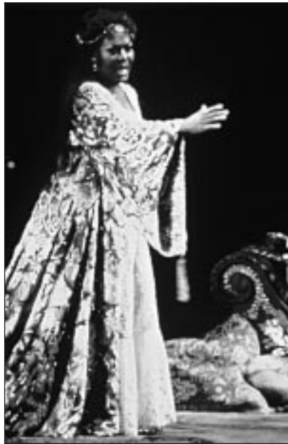
Shirley Verrett (photo) et Plácido Domingo dans « Samson et Dalila », à 22.45 sur Mezzo