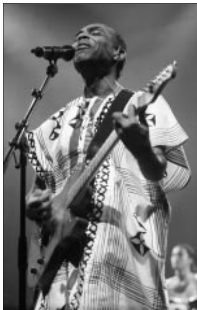
Gilberto Gil en concert, à 21.00 sur Muzzik