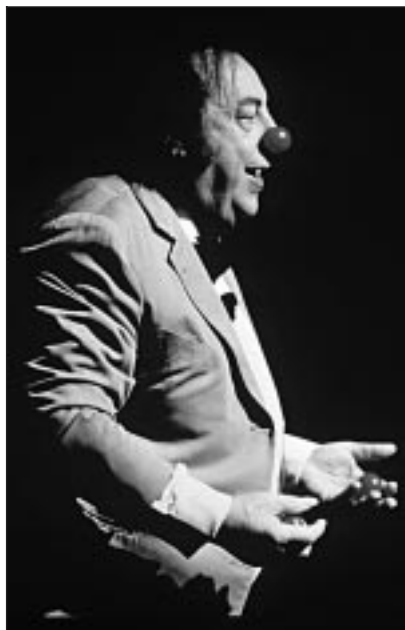
« Devos dans tous ses sens », à 21.00 Paris Première