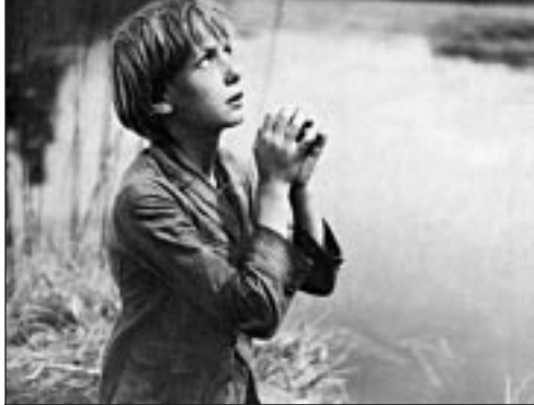
Robert Lynen dans « Poil de Carotte », à 21.30 sur Cinétoile

Une standardiste de nuit résout par téléphone les divers problèmes qui accablent un village savoyard.