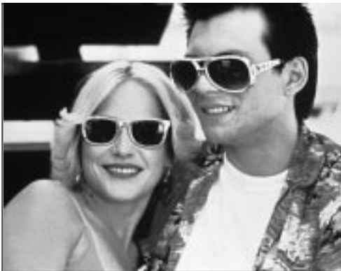
Patricia Arquette et Christian Slater dans « True Romance », à 20.30 sur Ciné Cinéma 3

MA SŒUR EST DU TONNERRE ■ ■ ■ 7.45 Cinétoile 509050473 Richard Quine. Avec B. Garrett (Etats-Unis, 1955, 100 min) ○ . Deux sœurs viennent à New York pour faire carrière.