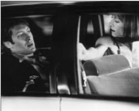
James Spader et Holly Hunter dans « Crash », à 20.30 sur Ciné Cinéma 3