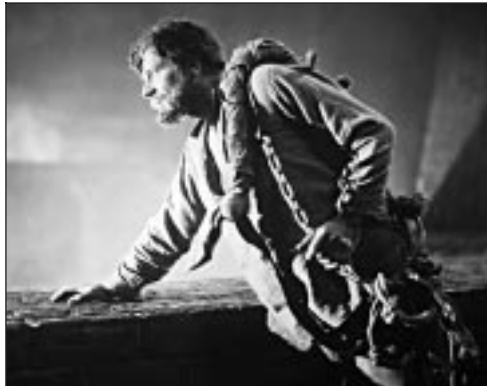
COLLECTION CHRISTOPHE L.

LES ENRAGÉS ■ 22.15 Ciné Cinéma 3 500458352 2.20 Ciné Cinéma 2 556382753 Pierre-William Glenn. Avec Fanny Ardant (France, 1984, 95 min) 0. Une célèbre actrice affronte, par le jeu de la séduction, deux malfrats qui la séquestrent dans sa villa.