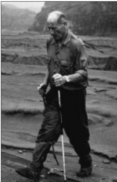
« Le Feu de la Terre », une série d'Haroun Tazieff, à 21.50 sur Odyssee